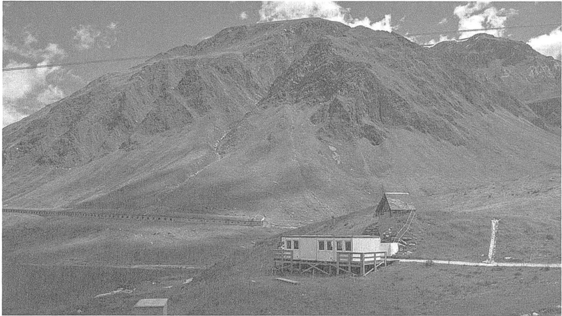
Abb. 3: Militärbunker auf dem Lukmanierpass: «abgelegenste[s] Asylzentrum der Schweiz».

Ein Blick in die Vergangenheit soll Aufschluss darüber geben, wie sich die Unterbringung von Geflüchteten in abgelegenen Bunkern und Kasernen in den Gemeinden durchsetzen und zum Common Sense werden konnte. Im Ersten Weltkrieg urteilte das Intelligenzblatt der Stadt Bern : «Es wäre kühn, die Flüchtlinge und Flüchtigen als einen Ersatz für das ausgebliebene Reisepublikum und Wintergastvolk einzuschätzen.» 50 Das Blatt war der Meinung, dass sich die Schweiz mit ihrer darniederliegenden Hotellerie «besonders zur Masseninternierung» eigne. 51 Die Quelle offenbart, dass Räume zur Beherbergung von Geflüchteten gesellschaftlich noch nicht definiert waren; infrage kamen Gastfamilien, Hotels, Pensionen, Sanatorien etc. Jedoch wurde bereits damals bei einigen Kriegsgefangenen auf die Infrastruktur der Armee zurückgegriffen: sogenannte renitente Internierte wurden in Militärkasernen untergebracht. 52