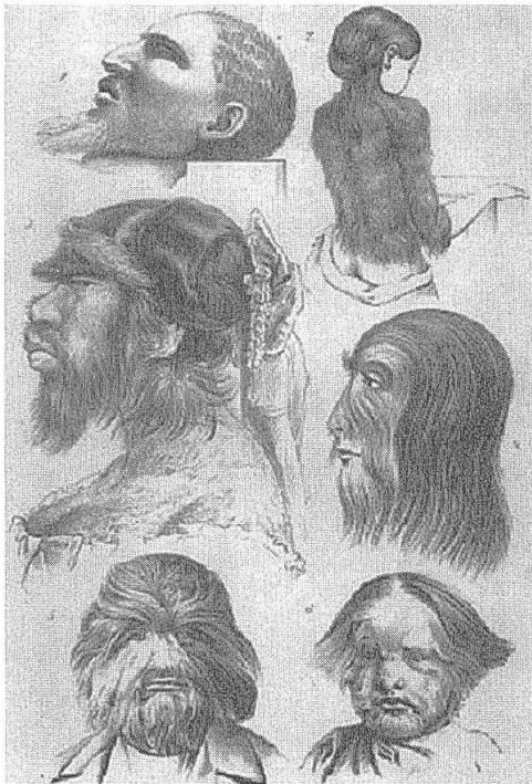
Abb. 1: Bildtafel aus einem Aufsatz von Max Bartels, 1876. Aus: Bartels, Max: Über abnorme Behaarung beim Menschen. In: Zeitschrift für Ethnologie 8 (1876), S. [130].