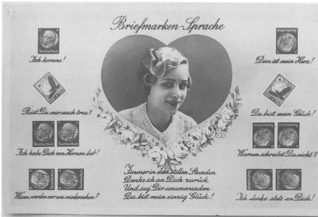
Abb. 2: Ansichtspostkarte, undatiert, ungelauften; Privatbesitz.