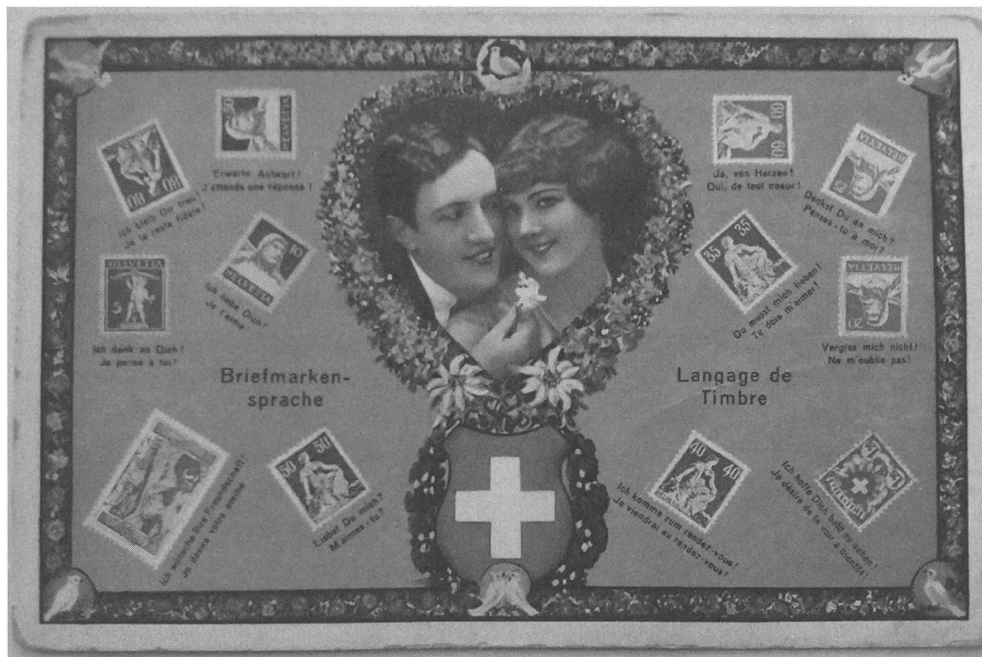
Abb. 1: Ansichtspostkarte, undatiert, ungelauften; Privatbesitz.

«Briefmarkensprache» und «Langage de Timbre» sieht man auf verschiedenste Art verdrehte Briefmarken, die mit Erläuterungen versehen sind: «Erwarte Antwort!» verlangt zum Beispiel eine um 90 Grad nach links gedrehte Marke, während eine spiegelbildlich gekippte ausruft: «Oui, de tout cœur!» 2 Ergänzend zum regulär geschriebenen Text eröffnet sich also eine zweite Mitteilungsebene, die lustvoll-spielerisch die Briefmarken sprechen lässt, wenn man sie nach den Vorgaben aufklebt.