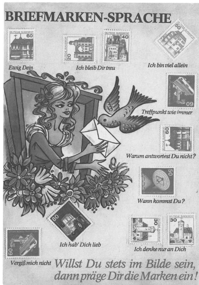
Abb. 3: Ansichtspostkarte, ungelauften, 1982; Museumsstiftung Post und Telekommunikation, Inventarnummer 3.2019.2125.