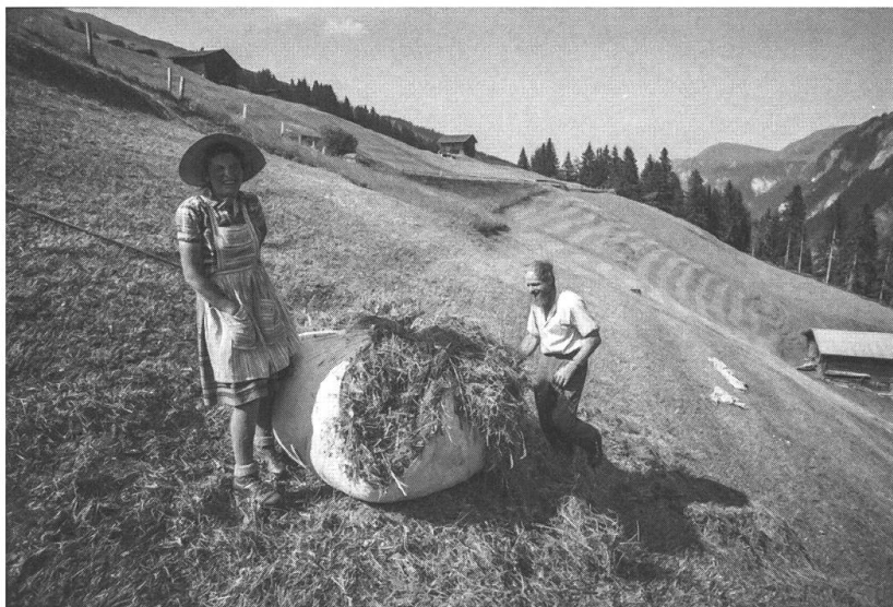
Noch 1976 war die Heuernte im Safiental fast reine Handarbeit.