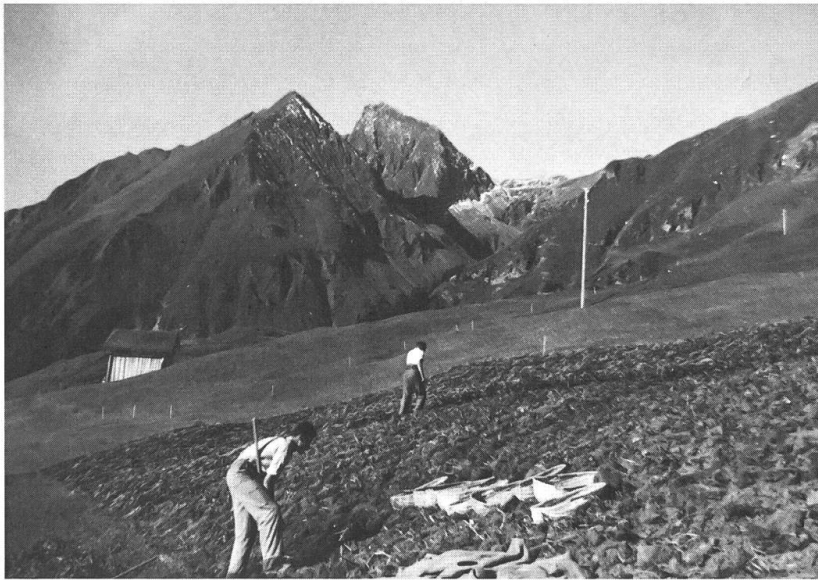
Kartoffelernte in Tenna in den 1950er-Jahren.