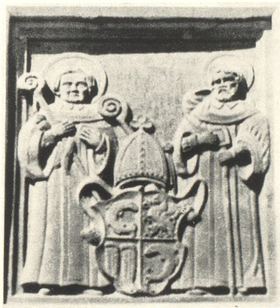
Wappentafel des Rheinauer Abtes Theobald Werlin von Greiffenberg. Um 1564 Die Schutzheiligen des Klosters, Fintan und Benedikt, als Wappenhalter