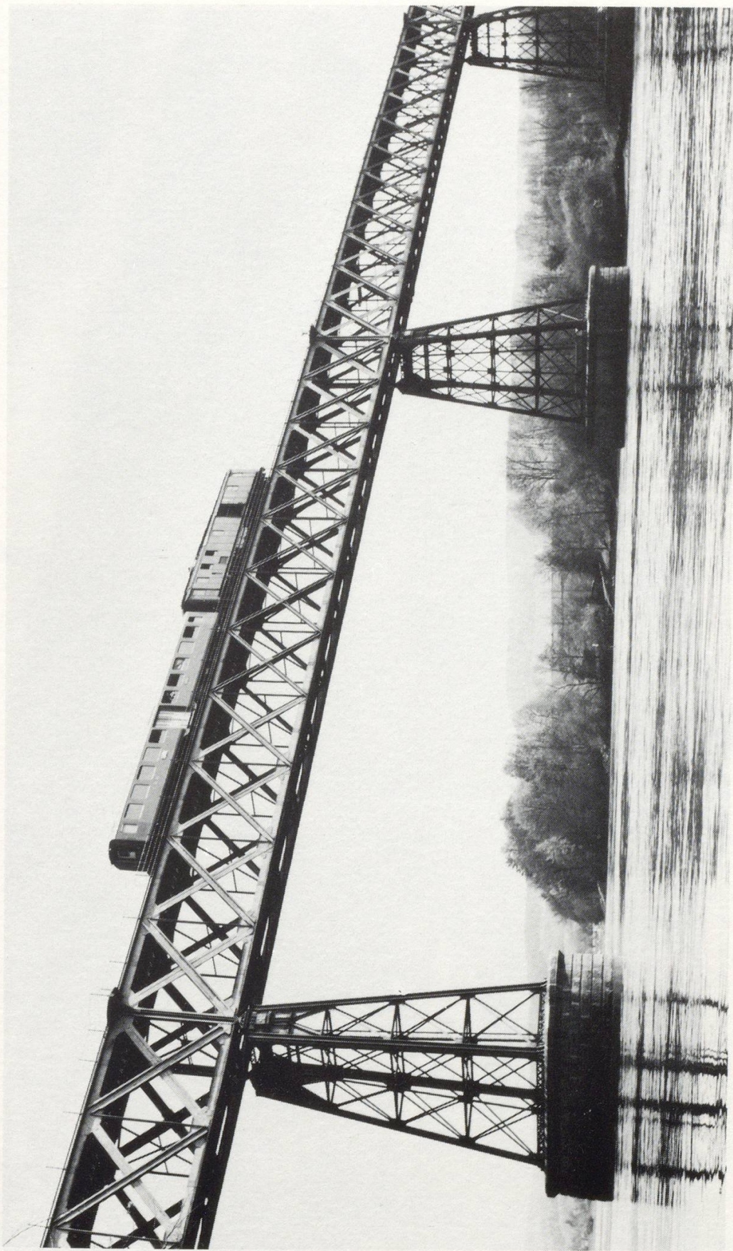
Bild 1 SBB-Linie Etzwillen-Singen. Personenzug auf der Rheinbrücke bei Hemishofen am 22. April 1968.