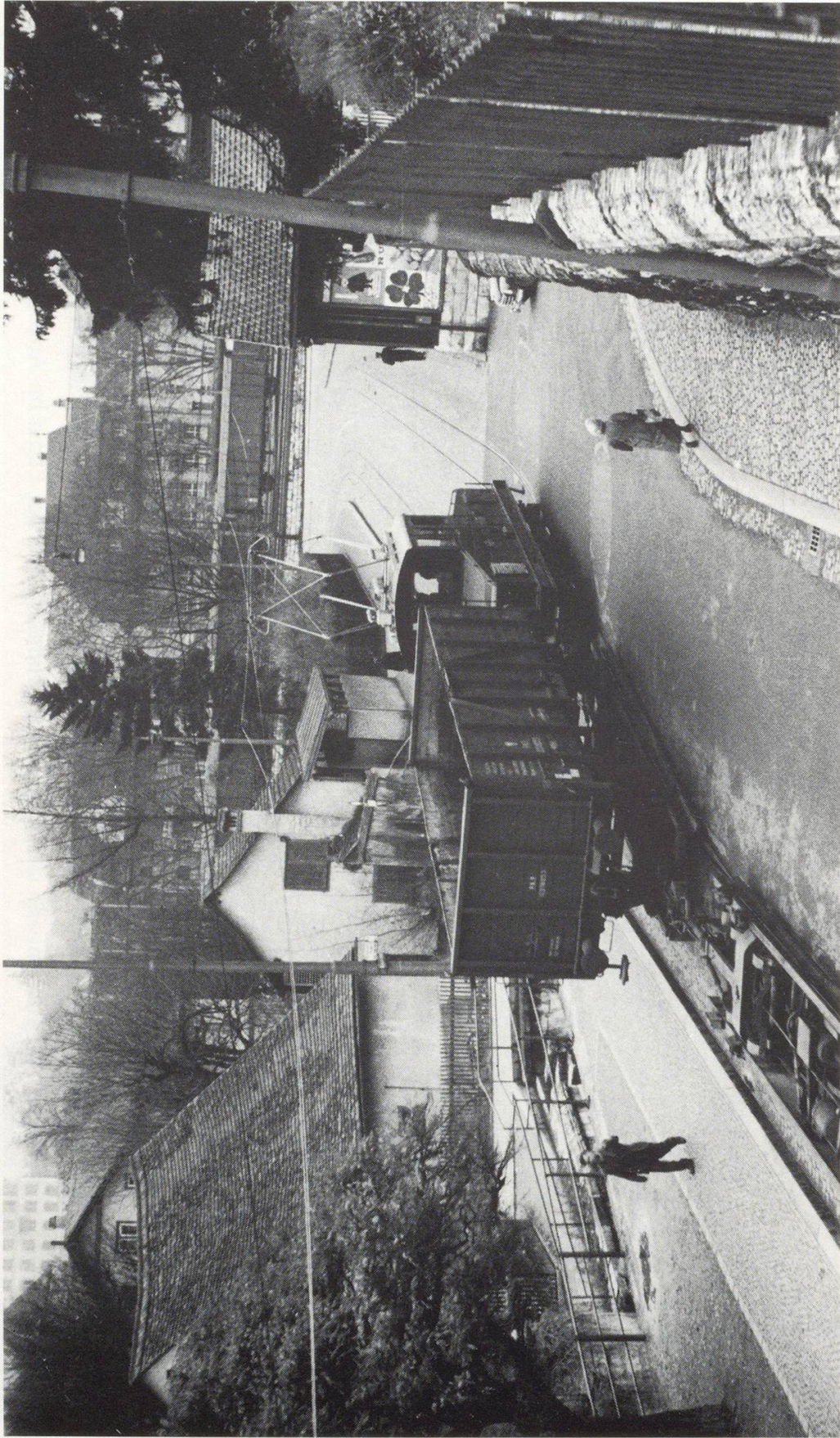
Bild 6 Rollschemelzug der +GF+-Werkbahn in der Mühltalstrasse, kurz vor der Einmündung in die Spitalstrasse. 1953.