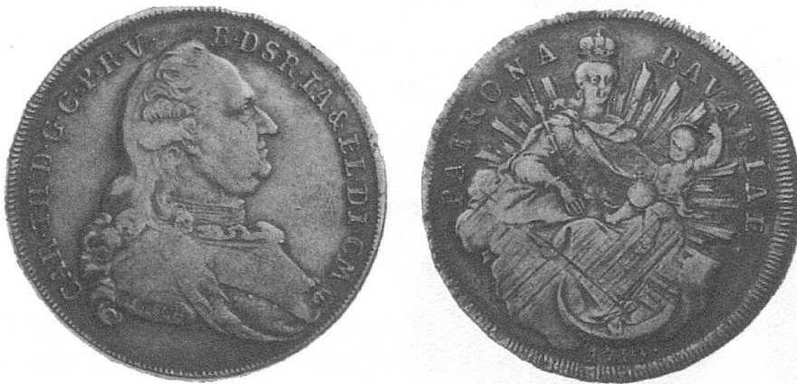
c) Bayern 1783 mit dem Kopf Carl Theodors, sogenannter Madonnentaler.