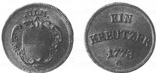
d) Stadt Ulm 1773