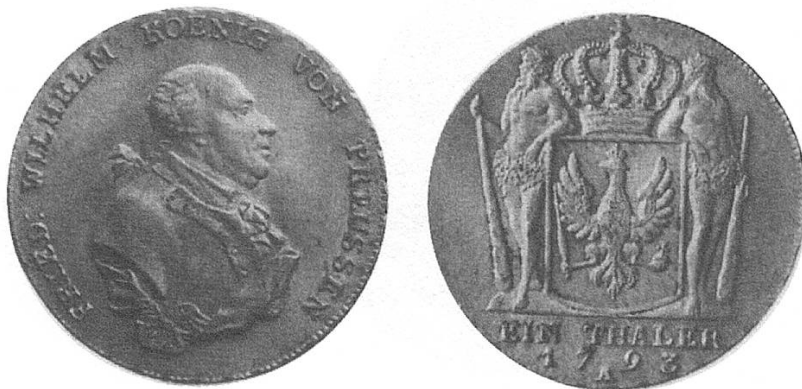
a) Reichstaler 1793, Brustbild Friedrich Wilhelms II.