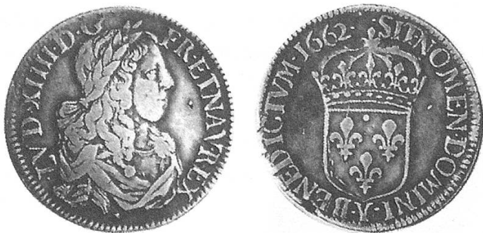
Französischer Halbtaler 1662, Louis XIV.

Verschiedene Versionen wie bei den ganzen Talern.