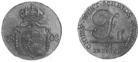
c) Kurfürstentum Württemberg 1803