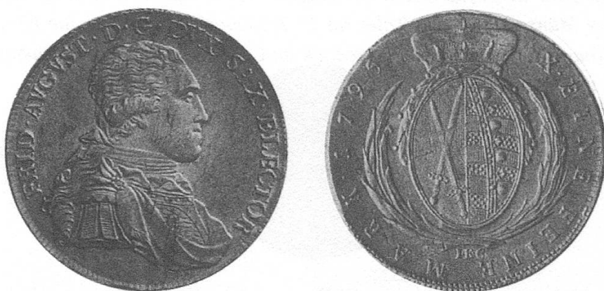
d) Kur-Sachsen 1795 mit dem Brustbild Friedrich Augusts III.