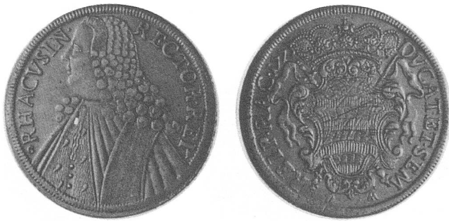
c) Republik Ragusa (Dalmatien) 1773, verschiedene Varianten. Alle drei Sorten sind den Konventionstalern gleichwertig.