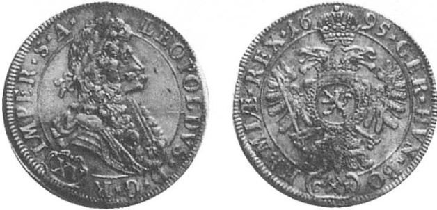
a) Österreich für Böhmen 1695, Brustbild Leopolds I.

Verschiedene österreichische und ungarische 15-Kreuzer-Stücke. Ob noch Stücke aus der Zeit Kaiser Leopolds I. kursierten, ist nicht überliefert. Der Name hat sich auf jeden Fall auf die Stücke der nachfolgenden Herrscher übertragen. Besonderes Kennzeichen: Wertbezeichnung XV.