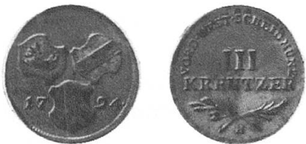
b) Vorderösterreich 1794, sogenannte Günsburger Dreier