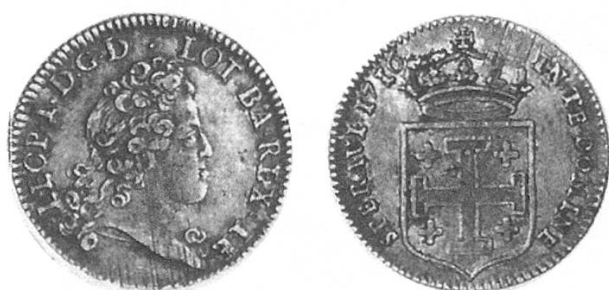
b) Lothringen Dicken 1716