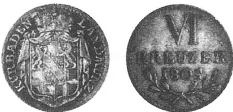
b) Kur-Baden 1805