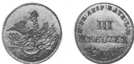
c) Preussen-Ansbach-Bayreuth 1795