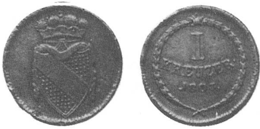
e) Kur Baden 1803