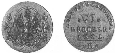
e) Brandenburg-Ansbach-Bayreuth 1801