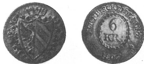
f) Stadt Nürnberg 1806