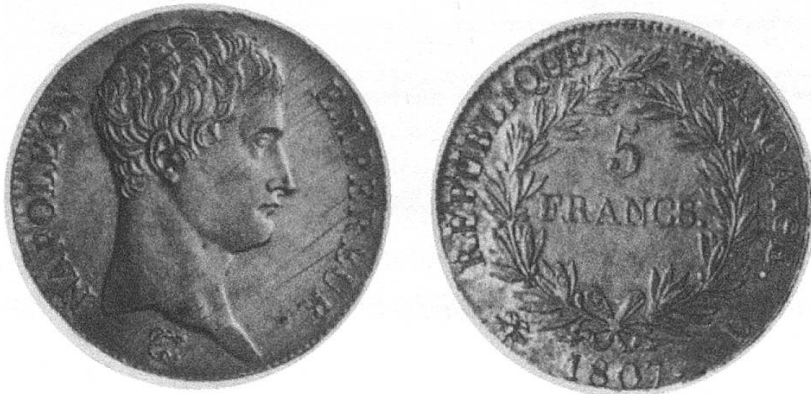
b) Französisches 5-Franken-Stück 1807, mit dem Kopf Napoleons I.