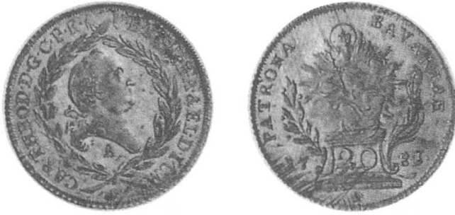
b) Kur-Bayern 1781, Kopf Carl Theodors.