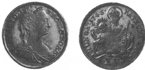
b) Ungarn 1743, Brustbild Maria Theresias.