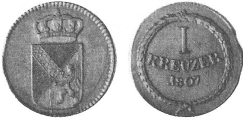
f) Grossherzogtum Baden 1807