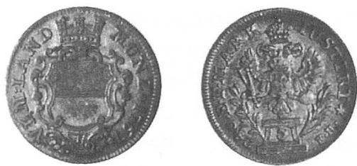
5 Konventionskreuzer der Stadt Ulm 1767,

Bis 1790 verschiedene Jahrgänge in ähnlicher Form.