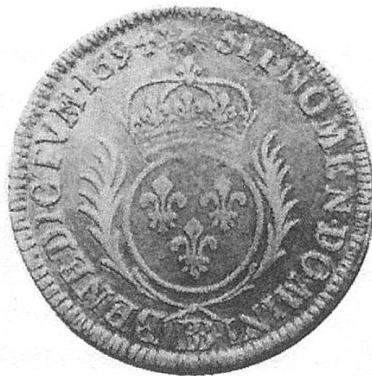
b) Strassburg 1694, überprägt auf XXX Sols