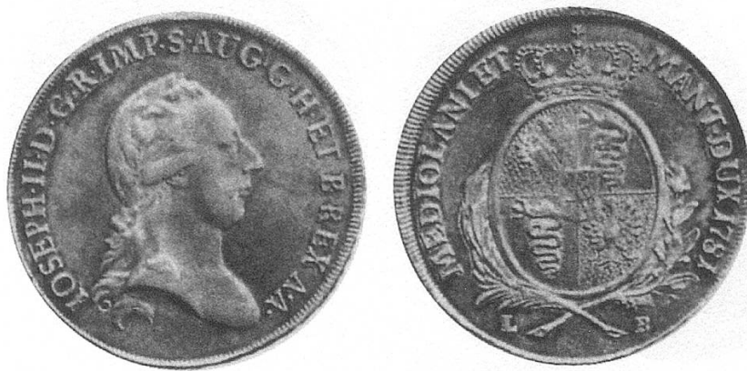
Österreich 1781, Joseph II. als Herzog von Mailand. Gleiche Taler auch von Maria Theresia.