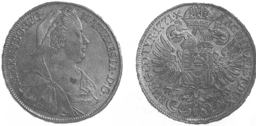
b) Österreich 1771 mit der Büste Maria Theresias, auch als Frauentaler bezeichnet.