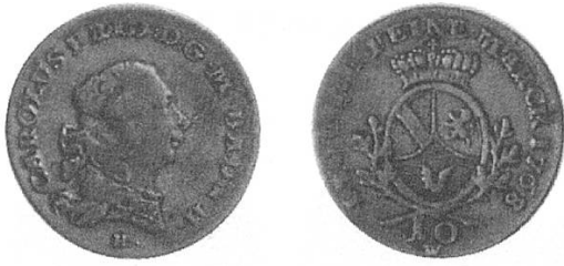
b) Baden-Durlach 1768, Kopf Carl Friedrichs