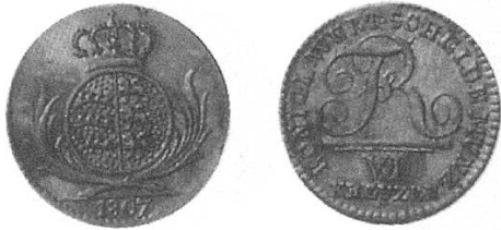
d) Königreich Württemberg 1807