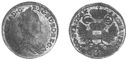
a) Österreich 1756, Maria Theresia

Diese sind von ähnlichem Aussehen wie die 6-Kreuzer-Stücke, gleiche Anmerkungen dazu. Die meisten der sich im Umlauf befindenen Stücke waren neueren Datums, ob auch noch ältere Groschen aus dem frühen 18. oder aus dem 17. Jahrhundert zirkulierten, ist nicht überliefert, aber durchaus möglich.