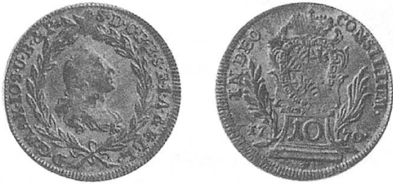
c) Bayern 1770, Kopf Maximilian Josephs