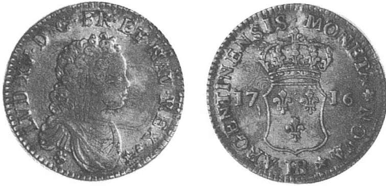
d) Strassburg 1716, mit Brustbild Louis XIV., überprägt auf ein ähnliches Stück von 1709.

Alle ausländischen Sechs-Kreuzer-Stück mit Ausnahme jedoch der bereits ganz ausser Cours gesetzten Leininger- und Coburger-Sechser 5 Kreuzer RW