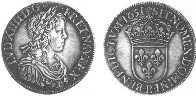
a) Taler 1651, mit dem Brustbild Louis XIV.

Darunter verstand man verschiedene alte französische Taler, meist noch aus dem 17. Jahrhundert. Die Benennung «Louis blanc» diente zur Unterscheidung vom «Louis d'or». Im Wert waren solche Taler den Konventionstalern gleichgesetzt.