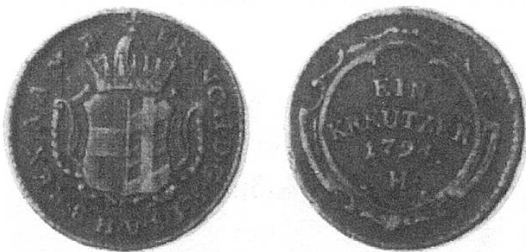
b) Vorderösterreich für Burgau 1794