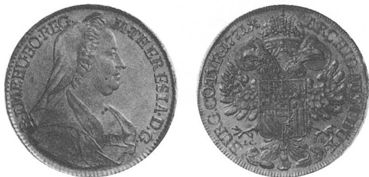
a) Österreich 1771 mit Büste Maria Theresias.

Gleiche Vielfalt wie bei den ganzen Talern.