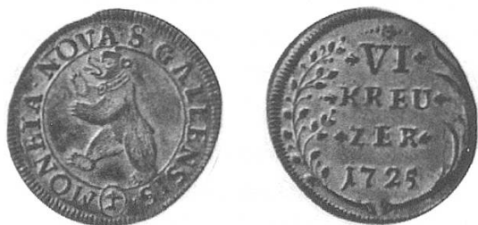
6 Kreuzer der Stadt St. Gallen 1725

Zwei Beispiele der privilegierten Sorten: