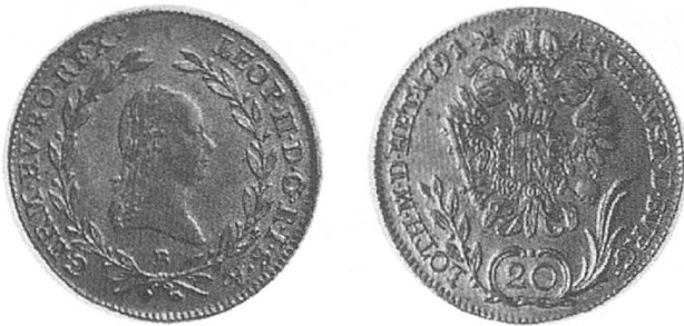
c) Österreich 1791, Kopf Leopolds II.