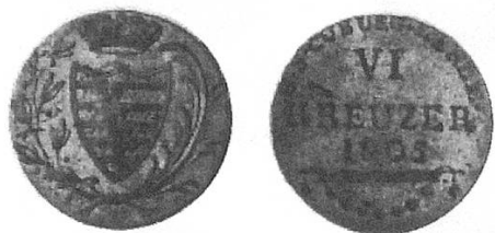
g) Coburger-Sechser 1805, wurden laufend verboten, tauchten aber immer wieder auf.