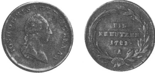
a) Österreich 1781

Auch diese ziemlich unhandlichen Kupfermünzen stammen aus den unterschiedlichsten Münzstätten in Deutschland und Österreich, ihres geringen Wertes wegen dürfte die Herkunft nicht gross beachtet worden sein.