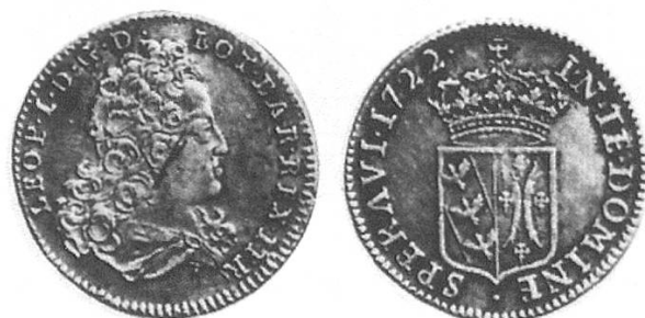
c) Lothringen Dicken 1722