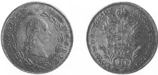
d) Österreich 1791, Kopf Leopolds II.