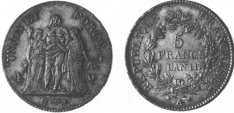
a) Französisches 5-Franken-Stück AN 11 (1802/03), vom Konsulat mit Herkulesgruppe.