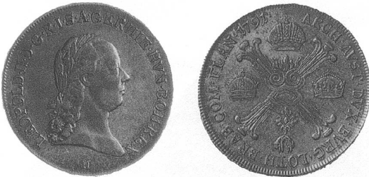
Von 1791 mit dem Kopf Leopolds II.

Gleiche Varianten wie bei den ganzen Talern.