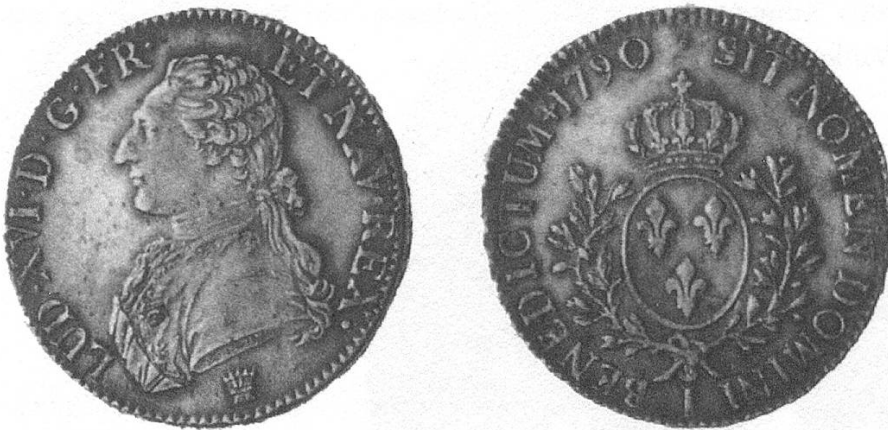
b) Von 1790 mit dem Kopf Ludwigs XVI.