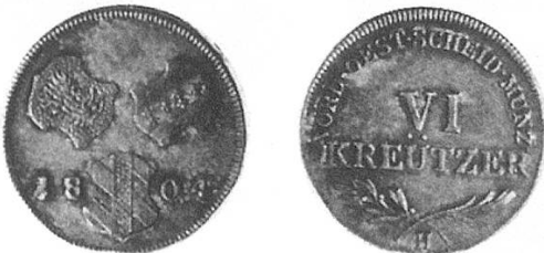
a) Vorderösterreich 1804, sogenannte Günzburgersechser (aus der Münzstätte Günzburg), waren in grosser Zahl im Umlauf, dienten zum Teil als Prägematerial für Neuprägungen in der Ostschweiz.

Eine Kleinsorte, die in Schaffhausen und in der ganzen Ostschweiz zirkulierte. Die bereits um 1807 vorhandene Vielfalt dieser Münzen wurde in den nachfolgenden Jahrzehnten noch erheblich vergrössert, bedingt durch die vielen politischen Veränderungen in Deutschland. 6- und 3-Kreuzer-Stücke sind dort im Übermass in Umlauf gesetzt worden und fanden bald auch den Weg in die Ostschweiz.