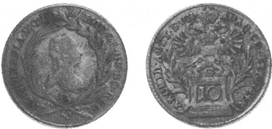
a) Österreich 1764, Kopf Maria Theresias

Diese sind von gleichem Aussehen wie die 20-Kreuzer-Stücke, waren aber weniger häufig im Umlauf. Sie wurden auch als halbe Kopfstücke bezeichnet. Die aufgeprägte Zahl 10 hatte im Gebiet des 24 Guldenfusses auch keine Gültigkeit, die Stücke kursierten in Schaffhausen für 12 Kreuzer.