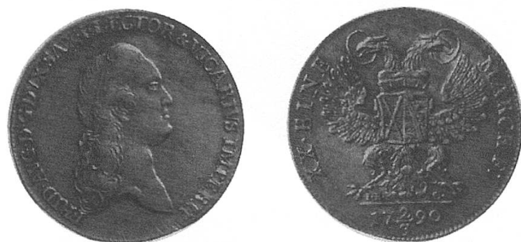
b) Kur-Sachsen 1790 mit dem Brustbild Friedrich Augusts III. Diese Münze trägt die Wertbezeichnungen zweier Münzsysteme, \frac{2}{3} Taler im 13 \frac{1}{2} Talerfuss und XX eine feine Mark 11 = 1 Gulden im Konventionsfuss, kursierte jedoch im Gebiet des 24 Gulden Fusses für 1 Gulden 12 Kreuzer (Schaffhausen).