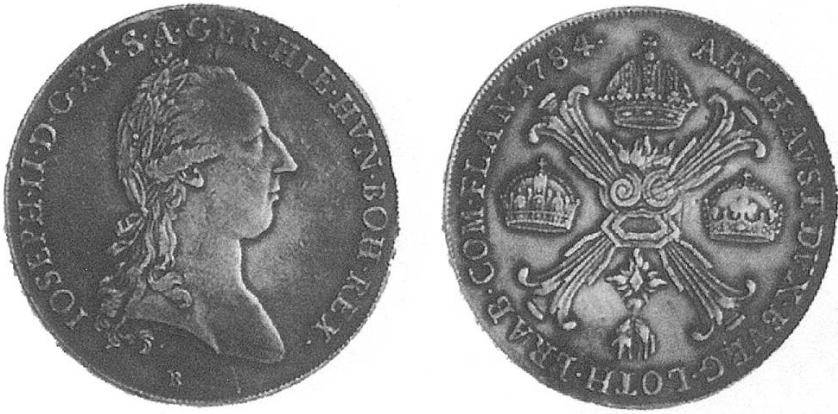
b) Von 1784 mit Kopf Josephs II.

Gleiche Stücke mit den Portraits Leopolds II. und Franz II.