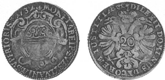
b) Obwalden 1732.