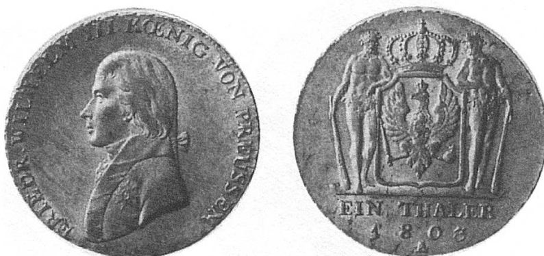
b) Reichstaler 1803, Brustbild Friedrich Wilhelms III. Es waren auch Stücke von Friedrich II. dem Grossen im Umlauf.