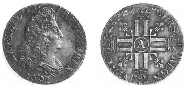
Französischer Vierteltaler 1691, Louis XIV.

Verschiedene Versionen wie bei den ganzen Talern.