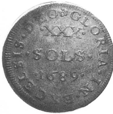
a) Strassburg 1689, XXX Sols