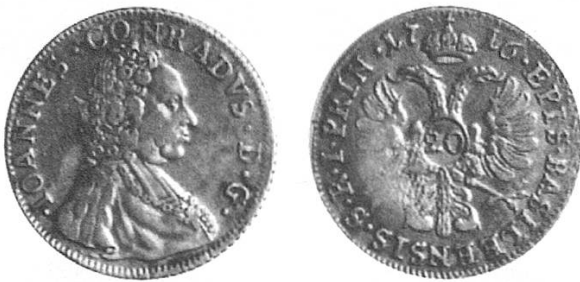
a) Bistum Basel 1716, Johann Conrad II.

Münztypen, die dieser Beschreibung entsprechen, sind nur von Bern (Mitte 17. Jh.), Obwalden, Zug, Freiburg, Bistum Basel und Bistum Chur geprägt worden, also alles schweizerische Gepräge. Wieso diese im Mandat figurieren, ist nicht ganz klar. Möglicherweise sind solche vom Reich her, wo ein Teil davon erwiesenermassen kursiert hat, nach Schaffhausen gelangt und dort als Reichsmünzen angesehen worden. Ausser den Stücken von Obwalden und vom Bistum Basel dürften um 1807 in Schaffhausen von den übrigen höchstens noch einzelne zirkuliert haben.