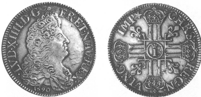
b) Taler 1690, mit dem Brustbild Louis XIV.