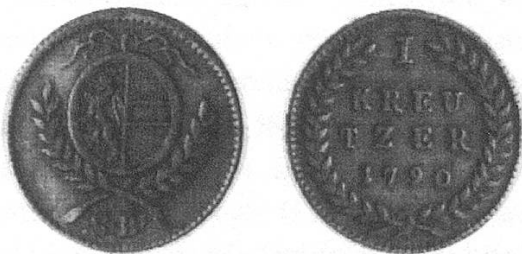
c) Erzbistum Salzburg 1790