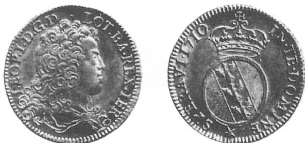
a) Lothringen Dicken 1710

Hier handelt es sich um Lothringer Dicken mit unterschiedlichen Rückseiten aus der Zeit von 1701 bis 1729, die in der Schweiz als Franken oder 10-Batzen-Stücke zirkulierten. 13