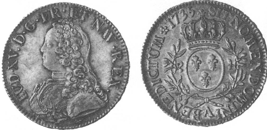
a) Von 1735 mit dem Kopf Ludwigs XV., verschiedene Portraits.

Französische Taler zu 6 Livres, auch Neutaler genannt, von 1726 bis 1792 geprägt. Die Bezeichnung Laubtaler kommt von den Lorbeerzweigen, die das gekrönte Lilienwappen einfassen.