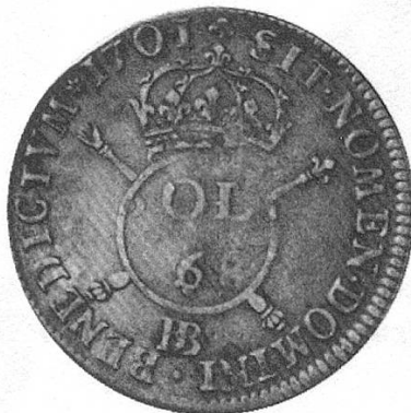
c) Strassburg 1701, überprägt auf XXX Sols 168?