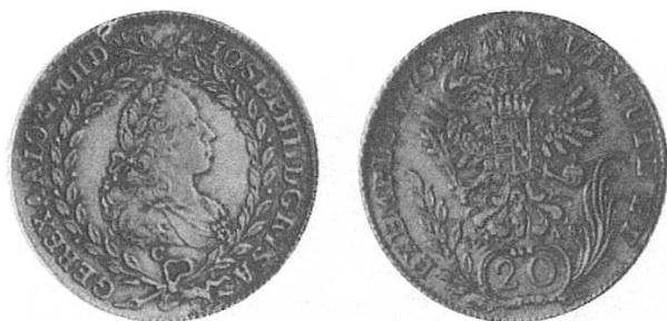
a) Österreich 1770, Kopf Josephs II.

Von Österreich seit der Mitte des 18. Jahrhunderts in grossen Mengen in verschiedenen Varianten nach dem 20-Gulden-Fuss geprägt. Der Name stammt vom auf-geprägten Kopf des jeweiligen Herrschers. Sie wurden von vielen deutschen Münzherren mit eigenen Münzbildern nachgeprägt. Waren in der Ostschweiz stark vertreten, galten dort aber nicht 20 Kreuzer wie angeschrieben, sondern 24 Kreuzer oder 6 Batzen.