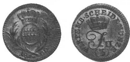
d) Herzogtum Württemberg 1800