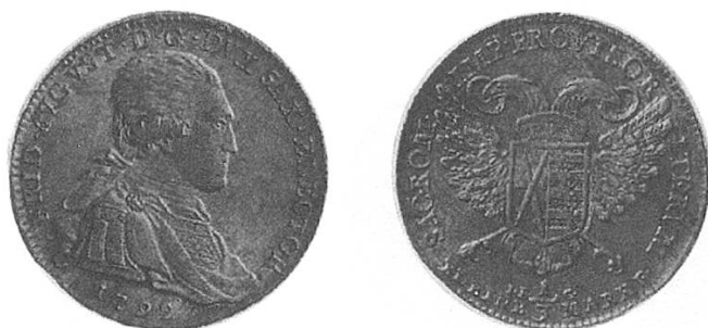
Kur-Sachsen 1792 mit dem Kopf Friedrich Augusts III. Verschiedene Wertangaben wie beim Halbtaler.

Diese Münzen sind weniger zahlreich und von weniger Münzherren ausgegeben worden.