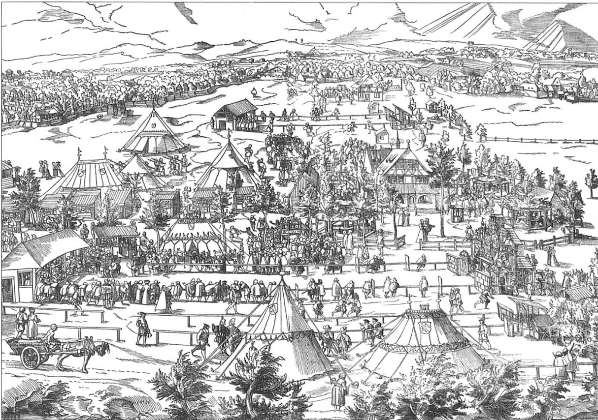
Das grosse Strassburger Freischiessen von 1576, an dem auch 17 Schützen aus Schaffhausen teilnahmen, wurde vom Schaffhauser Künstler Tobias Stimmer auf einem detailreichen Holzschnitt festgehalten. (Ausschnitt aus einem Faksimile in: Tobias Stimmers Strassburger Freischiessen vom Jahre 1576, hg. v. August Schrieker, Strassburg 1880)

neun Büchenschützen teil und dies zudem mit beachtlichem Erfolg: Drei von ihnen gehörten immerhin zu den Siegern im Armbrustschiessen. 213 Im Sommer 1523 wurde in Basel abermals ein gross angelegtes Schiessen veranstaltet, wobei acht Tage mit dem Bogen und acht Tage mit der Büchse geschossen wurde. Jeder Schaffhauser, der sich an diesem Wettbewerb beteiligte, erhielt vom Rat ein Reisegeld von 1 Gulden, ausserdem wurde den Preisgewinnern für jeden Gulden, den sie über den Betrag von 10 Gulden hinaus erkämpften, eine Prämie von einem halben Gulden versprochen. 214 Auch am nächsten «hauptschießen ze Basel mit dem armbrust», das im August 1541 auf dem Sankt Petersplatz ausgetragen wurde, nahmen zwei Schaffhauser Schützen teil. Beiden gewährte der Rat auf ihr Ersuchen je 2 Gulden Zehrgeld, «und sölln sich geschicktlich halten», so fügte er mahndend bei. 215