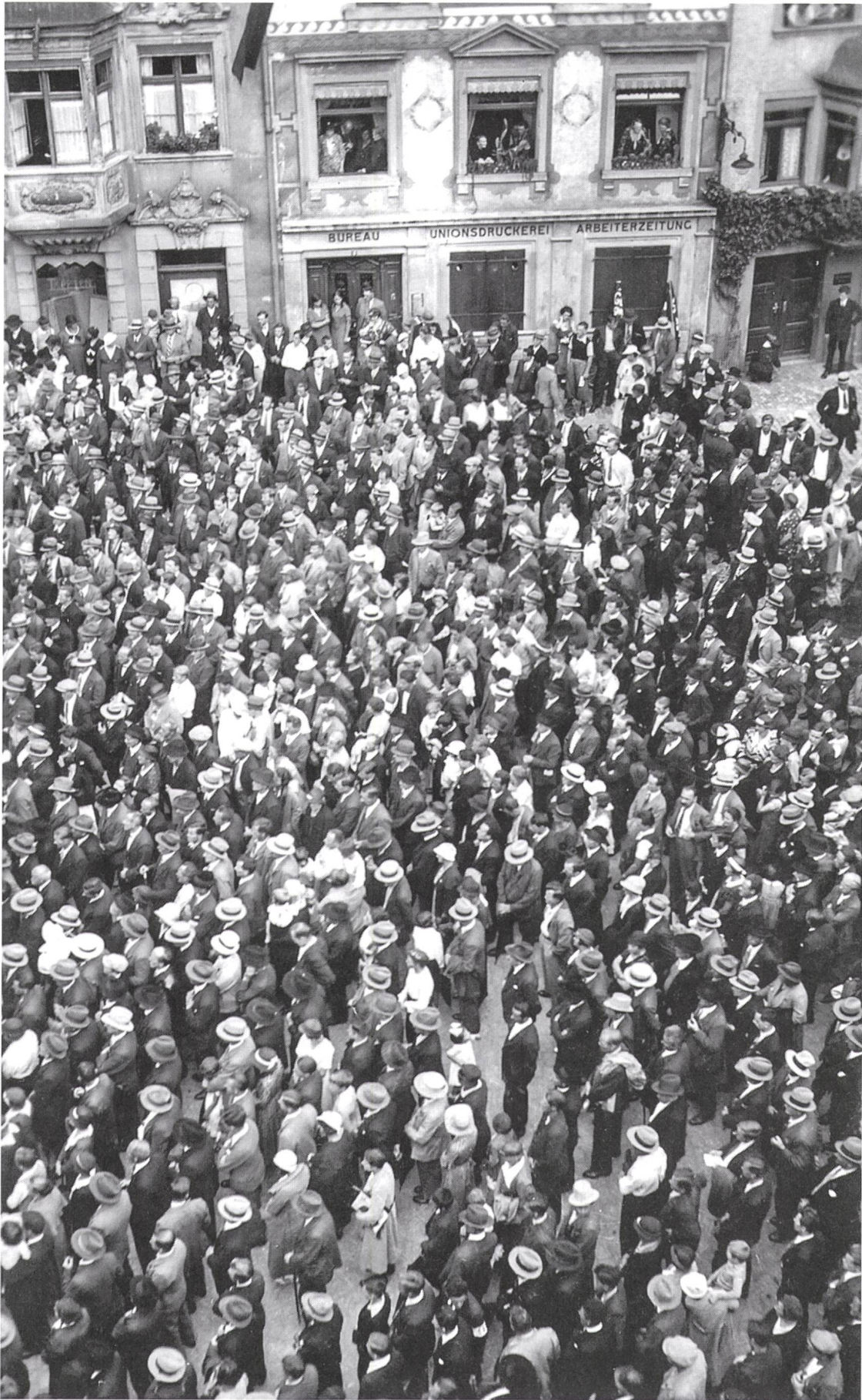
27 Grossaufmarsch am 1. Mai 1934.