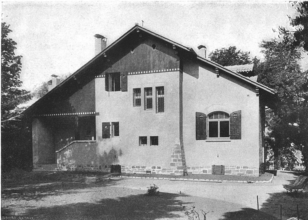
„La Belotte“ bei Genf. — Architekt (B. S. A.) Maurice Brailard, Genf.