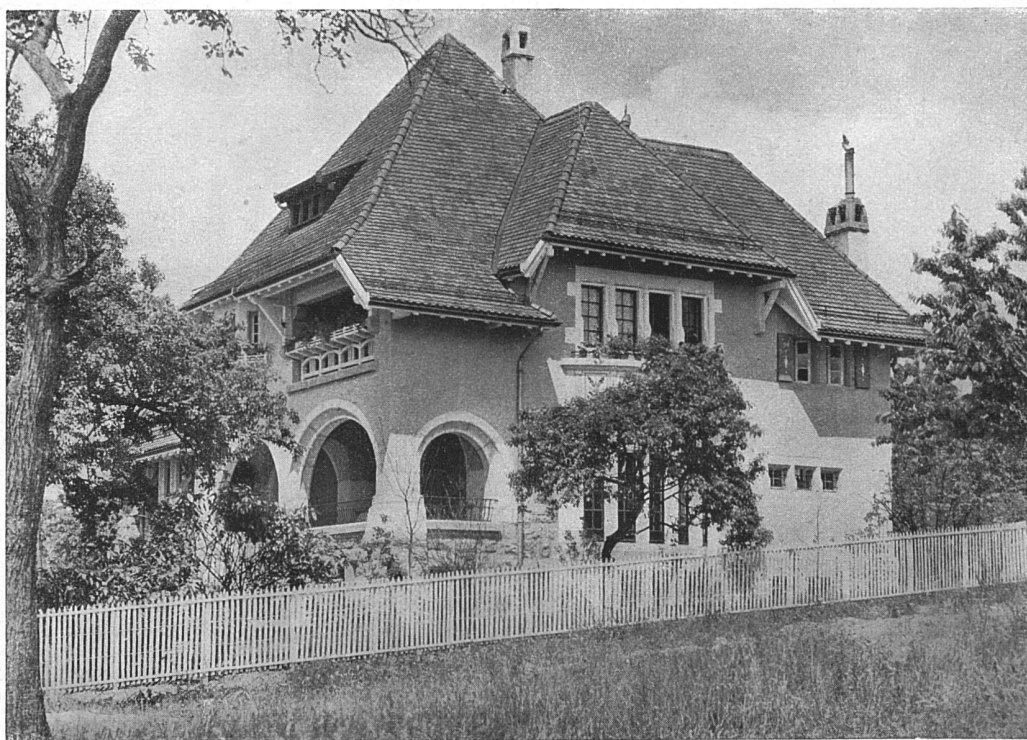
„La Rosiaz“ bei Lausanne. — Architekt (B. S. A.) G. Epitaur, Lausanne

Aus „Villen und Landhäuser in der Schweiz.“ — Von Architekt (B. S. A.) Henry Baudin, Genf Verlag für Kunst und Architektur, Genf, Rue St. Durs 6