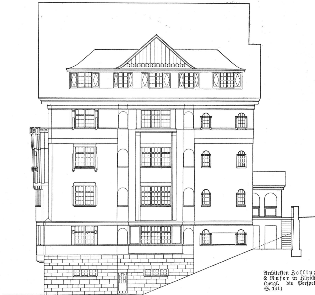
Miethaus an der Kirchbergstrasse in Zürich-Wollishofen. Nordfassade. — Maßstab 1 : 200

Die ehemalige Vogel-Fierz'sche Liegenschaft an der Berg-, Heuel-, Sonnenberg- und Aurorastraße, 52 000 m 2 messend, ist an ein Konsortium zur Ueberbauung verkauft worden. Auf diesem Gelände soll ein Villenquartier entstehen, dessen Ueberbauungsplan von den Architekten, B. S. A., Gebr. Pfister in Zürich ausgearbeitet wird. Das Baureglement für dieses Quartier schreibt vor, daß nur Villen erbaut werden dürfen mit einem Bauabstand von 12 m, so daß selbst bei Abgabe kleinerer Parzellen eine zu enge Ueberbauung vermieden wird.