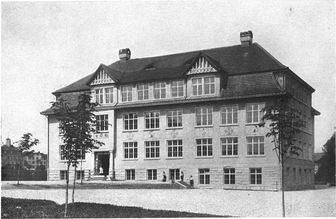
Ansicht der Rückfassade