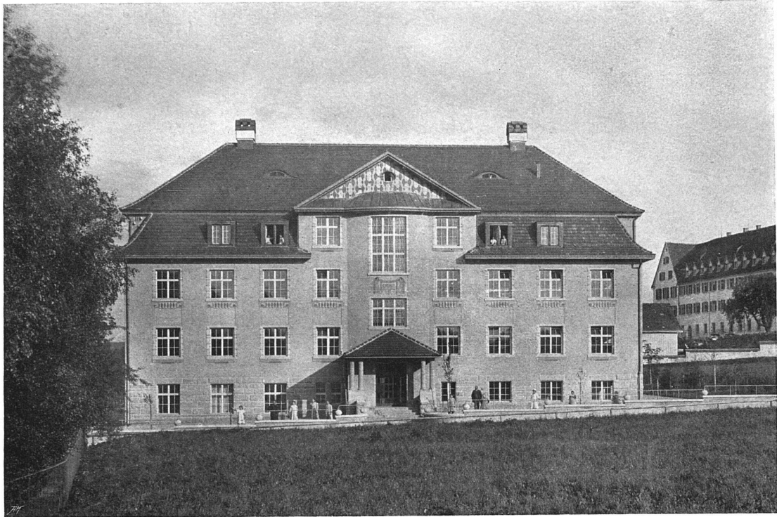
Ansicht der Hauptfassade