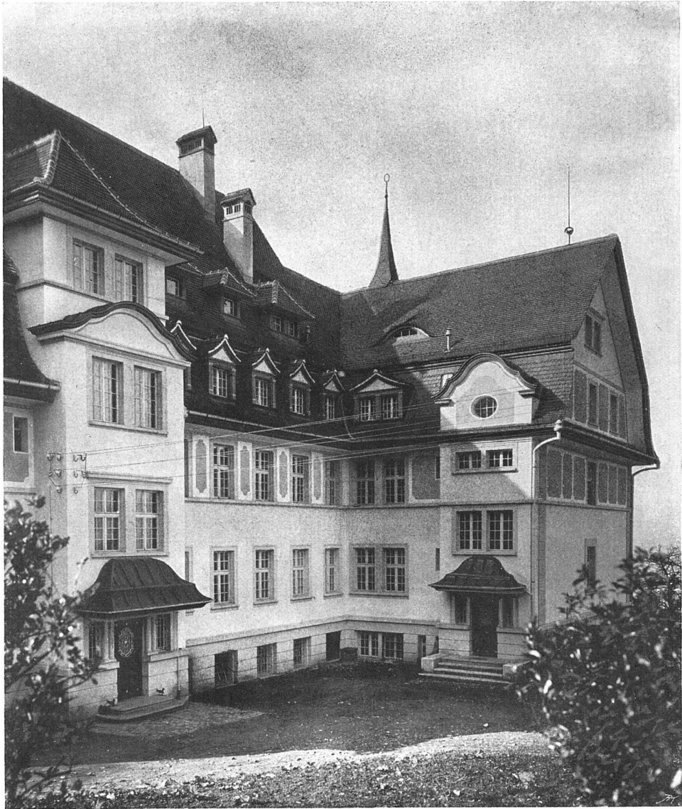
Ansicht der Nordfassade

Das Nervenanstorium „Franziskusheim“ in Oberwil bei Zug