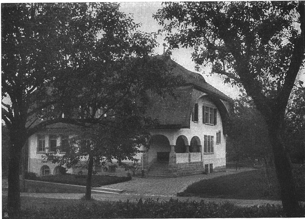
Das Sekundarschulhaus in Lützelstüh