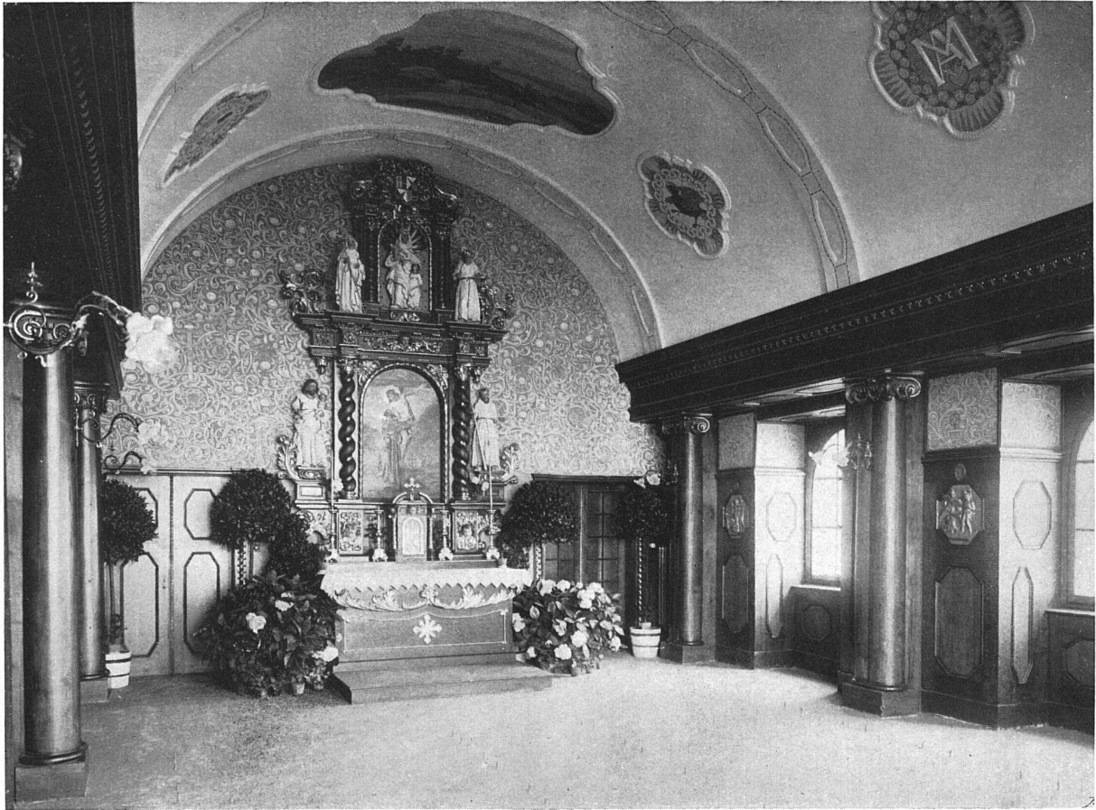
Die Anstaltskapelle