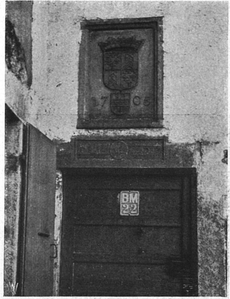
Türdetail aus den Freibergen