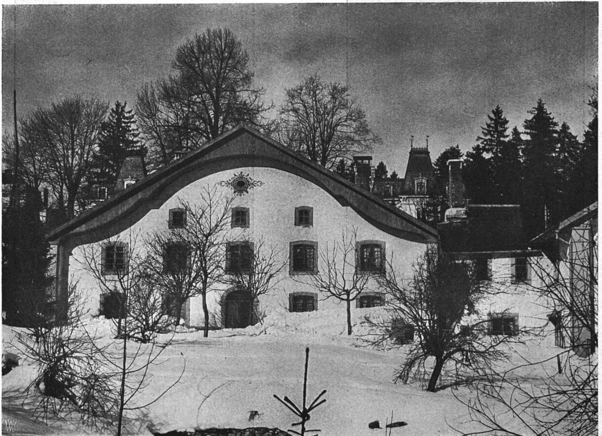
Altes Haus aus Chaux-de-Fonds

Von jurassischen Bauernhäusern.