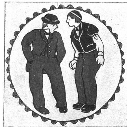
Kachelnfrics am Ofen im Restaurant Hader in Bern. — Entwurf Kunstmalers E. Lind in Bern. — Ausführung Wannenmacher & Chipot in Biel