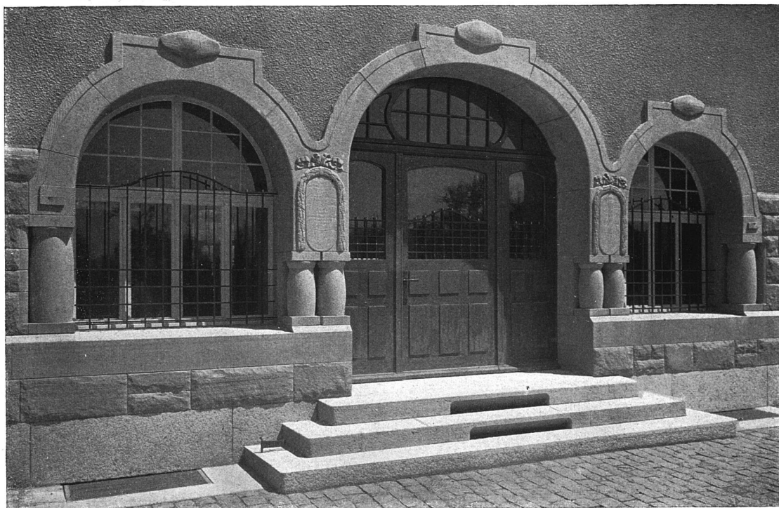
Teilansicht des Haupteingangs

Bahnhof und Post in Teufen. — Architect (B. S. A.) Alfred Cattat in St. Gallen