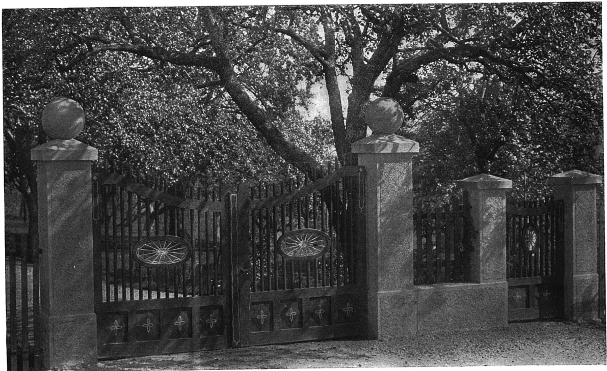
Tor der Garteneinfriedigung

Das Landhaus Laemmlin in St. Gallen. — Architekt (B. S. A.) Alfred Cattat in St. Gallen