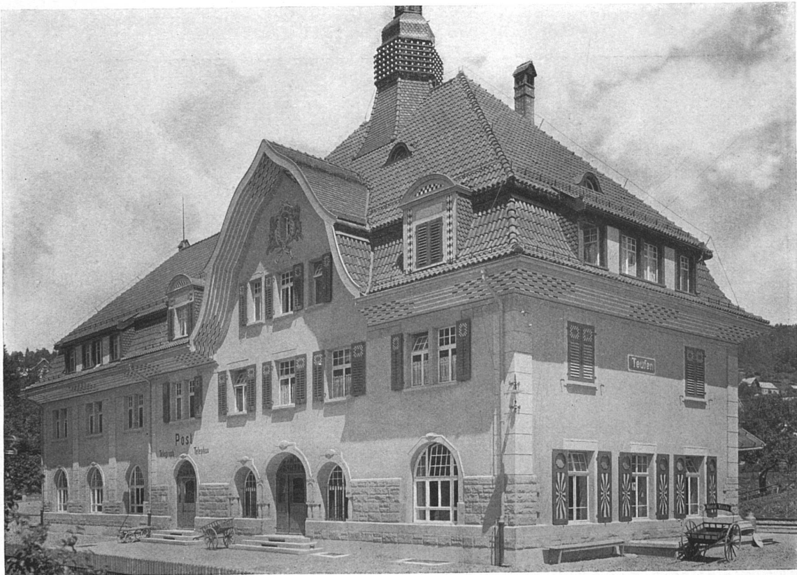
Fassade gegen das Dorf

Bahnhof und Post in Teufen. — Architekt (B. S. A.) Alfred Cattat in St. Gallen