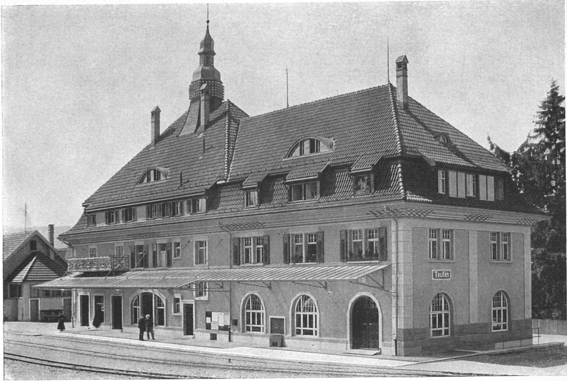
Fassade gegen die Bahnlinie