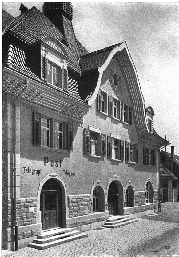
Fassade gegen das Dorf