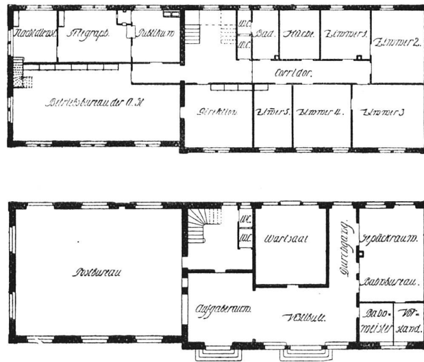
Grundriß vom Erd- und Obergeschoß. — Maßstab 1:400

Bahnhof und Post in Teufen. — Architekt (B. S. A.) Alfred Cuttat in St. Gallen