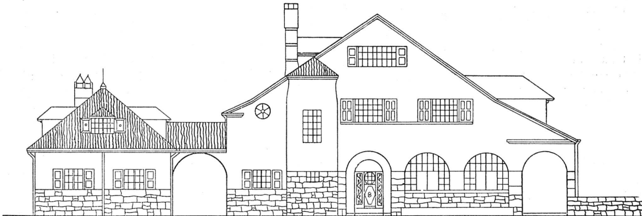
Fassade gegen die Landstraße. — Maßstab 1:200

gegen germanische. Dies verlangt die moderne Formensprache gar nicht. Der Pariserstil aber, der sich weder durch Ueberlieferung noch durch große Zweckmäßigkeit ausweisen kann, ihm wird die Fehde erklärt. Es fehlt auch in den Kantonen Genf, Waadt, Freiburg, Neuenburg und dem Berner Jura nicht an trefflichen Vorbildern, die wegweisend, Vorbilder, die sowohl in Bezug auf harmonische Fassadengestaltung