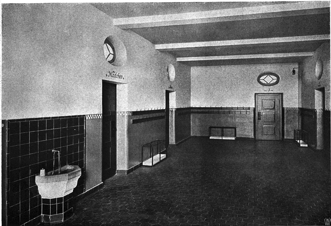
Blick in den Korridor

Das Schulhaus zu Safenwil. — Architekten (B. S. A.) Kneill & Hässig in Zürich