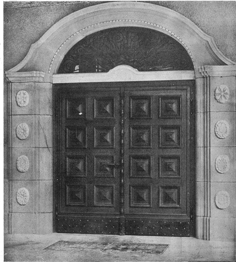
Das neue Hauptportal der Kirche. Einfassung in Kunststein

Die Restauration der Pfarrkirche zu Arbon. Architekten Kellenberger und Wildermuth in Arbon