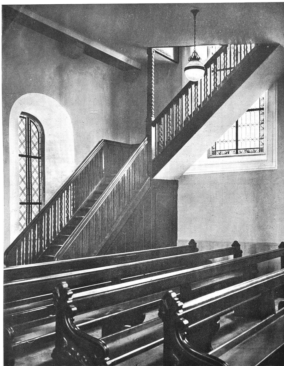
Die neue Emporentreppe