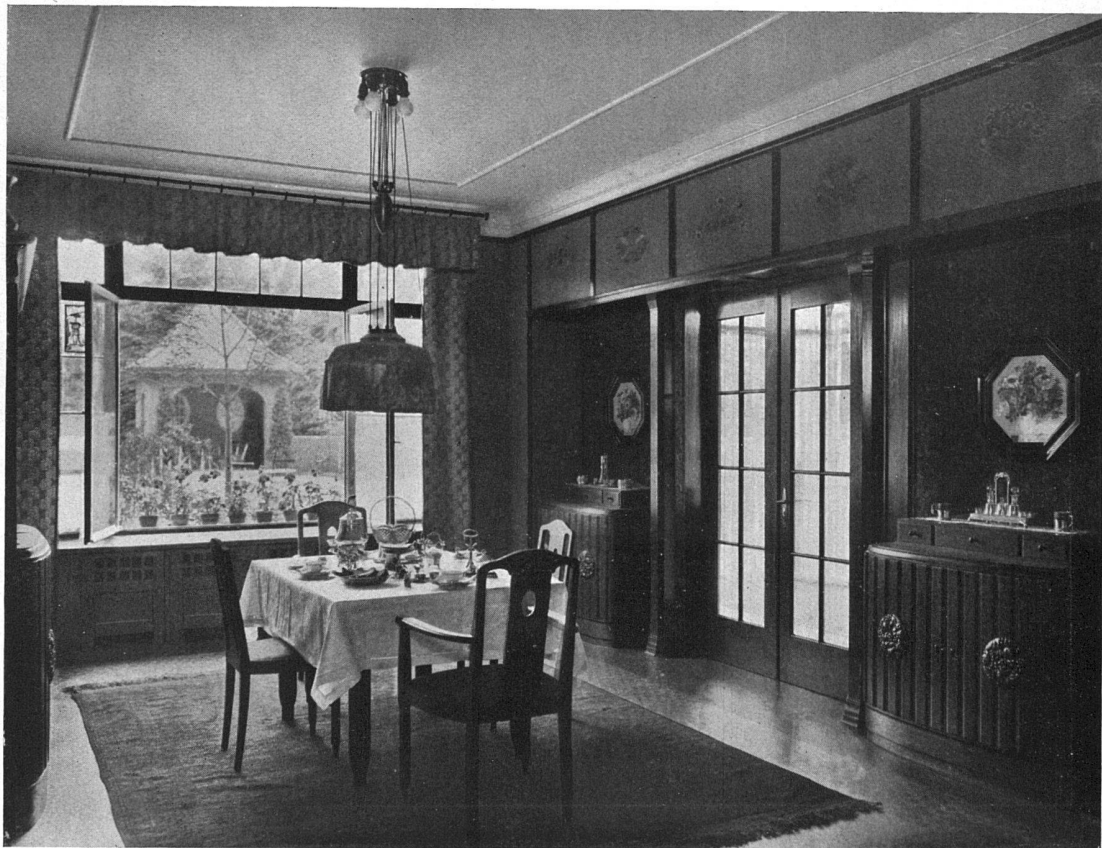
Esszimmer im Parterre mit Blick in den Garten

Eines aber haben die meisten gemeinsam: Einen chronischen Mangel an Arbeit, an Aufträgen! Wenn auch nur jeder einzelne ein einzig Häuschen unter Dach brächte im Jahr, bedeutete dies einen Zuwachs von mehreren Tausend Häusern! Und sitemalen unsere Kollegen welscher Zunge das kleine Einfamilienhaus als