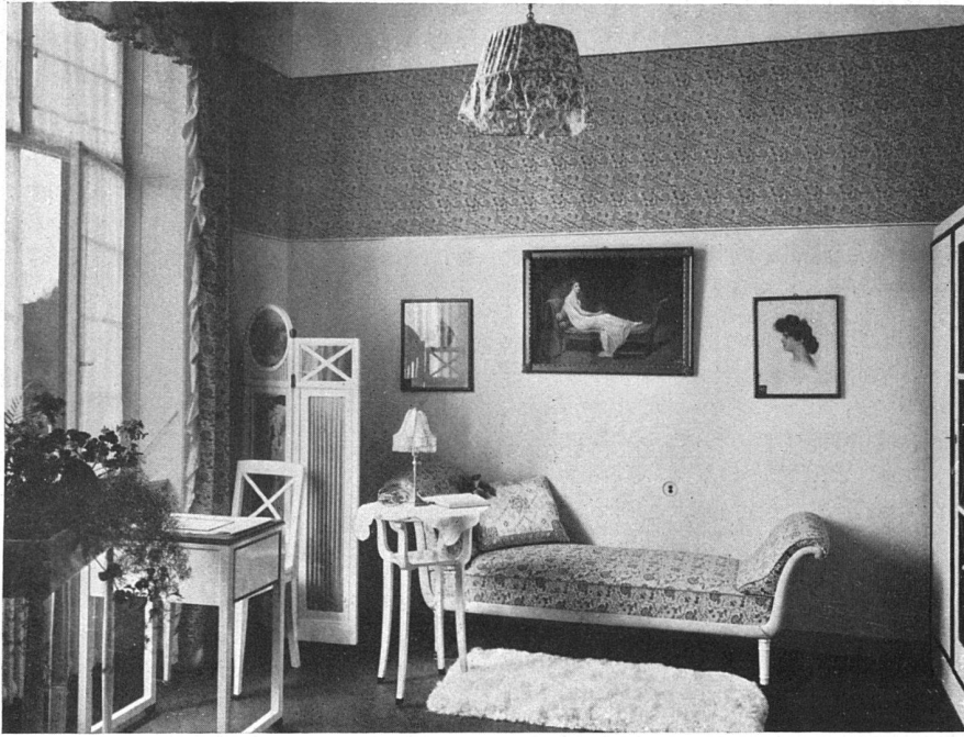
Toilettenzimmer im II. Stock