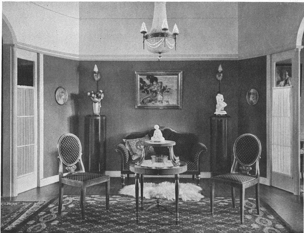
Salon im II. Stock