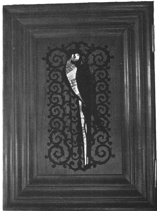
Schloss Hülchrath bei Düsseldorf des Herrn E. R. v. Bennigsen. Türchen der Heizkörperverkleidungen im Schlafzimmer des Herrn. Architekt Otto Zollinger, Zürich 7, Zeltweg.