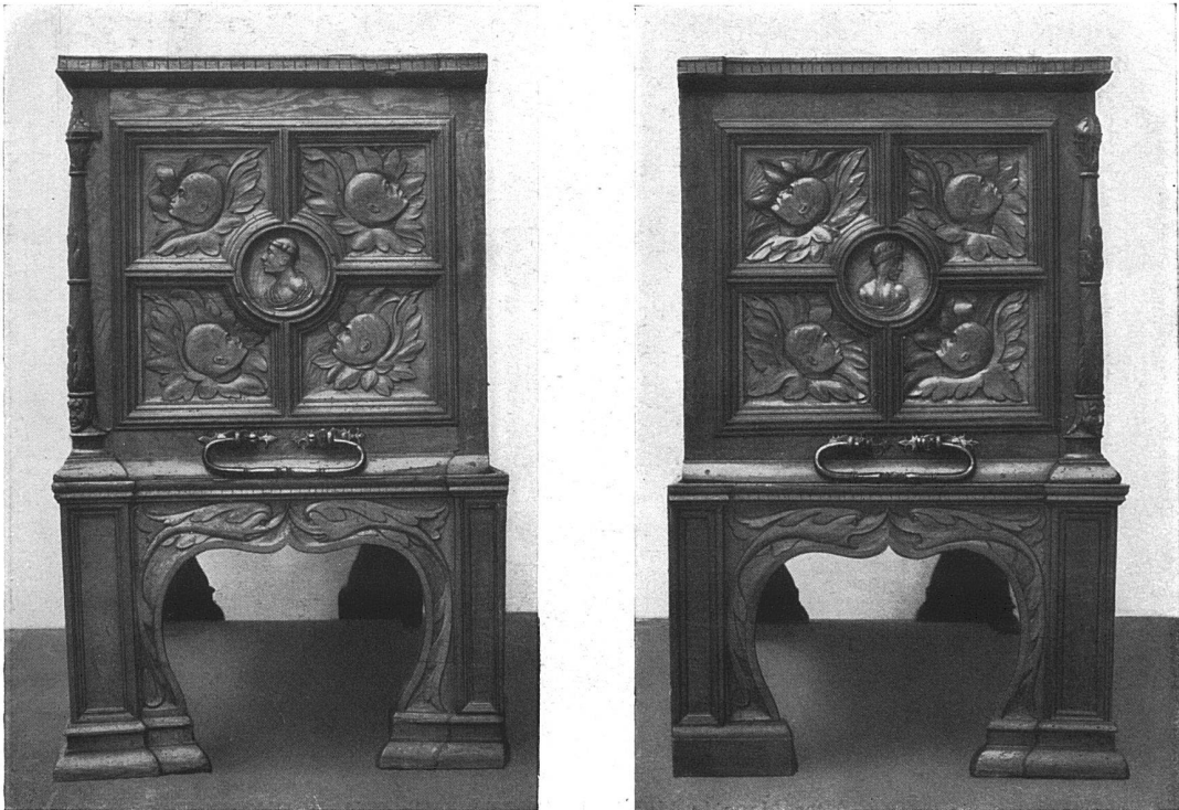
Basler Renaissance-Truhe von 1539. — Die Seitenwände. Im Historischen Museum zu Basel. (Vgl. die Vorderansicht auf der nächsten Seite.)