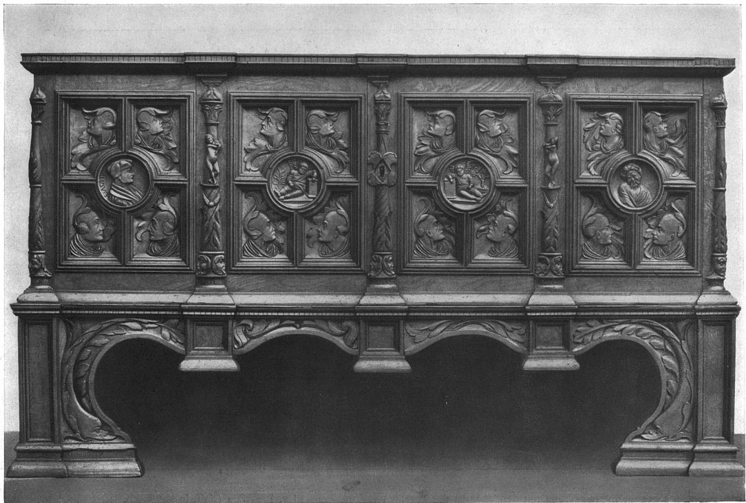
Basler Renaissance-Truhe von 1539. Im Historischen Museum zu Basel.