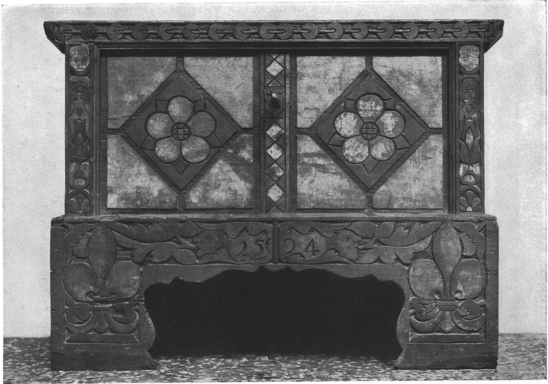
Gotische Truhe mit Renaissance-Ornamentik, von 1594. Im Historischen Museum zu Basel.