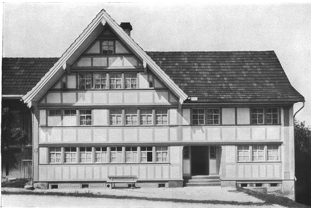
Altes Haus in Hundwil, Kt. Appenzell A.-R.