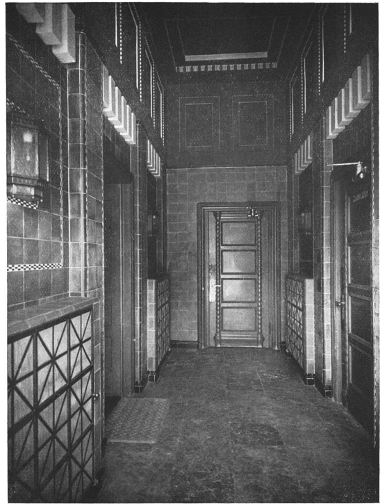
Entrée am Bahnhofquai. Hemixemplatten graugelb und schwarz (matt). — Decke karmin- und zinnberrot.

Aus dem Hause Du Pont zu Zürich. — Architekten Haller & Schindler, Zürich.