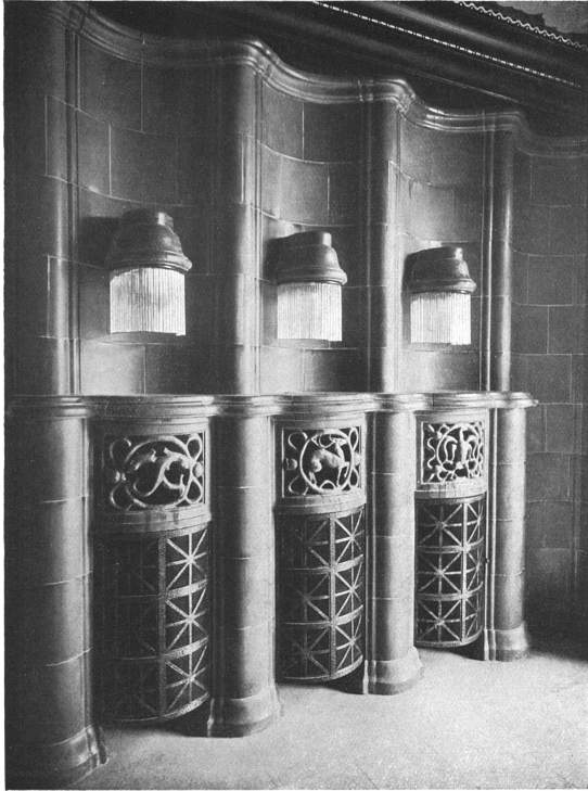
Detail vom Entrée am Beatenplatz (vergl. S. 309). Bildhauerarbeiten von Gysler, Zürich.