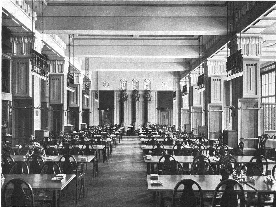
Das grosse Restaurant im Hause Du Pont zu Zürich. — Architekten Haller & Schindler, Zürich. Gipsarbeiten von Ryffel, Zürich; Beleuchtungskörper in schwarz poliertem Holz mit Messing von E. Nöbel, Zürich. Farbenangaben vergl. S. 313.