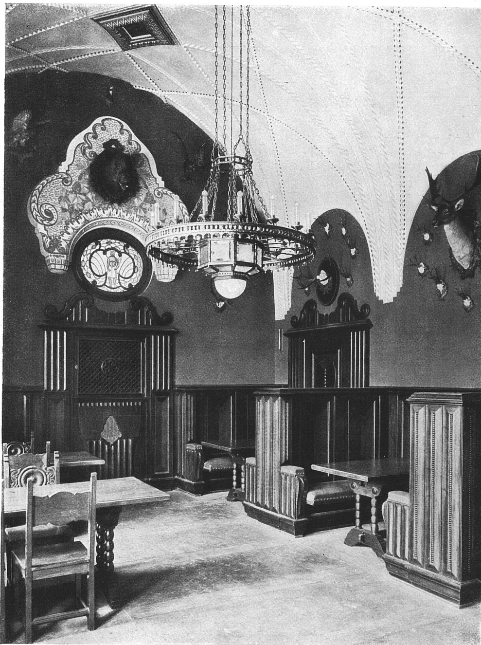
Das Jägerstübl im Hause Du Pont zu Zürich. — Architekten Haller & Schindler, Zürich.

Wandbespannung olivgrün; Decke blau in blaugrün; Holzwerk dunkel Nussbaum mit schwarzen Stäben; Boden Linoleum ziegelrot und schwarz in Felder geteilt. Malerarbeiten von Christian Schmidt, Zürich.