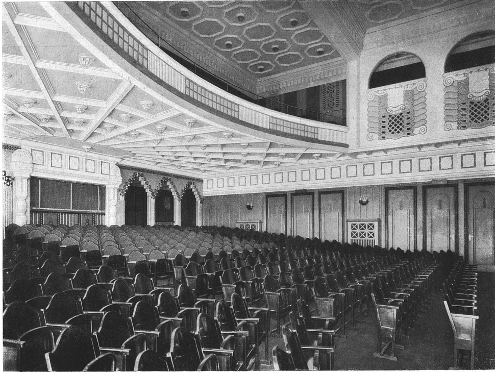
Der Kinosaal im Hause Du Pont zu Zürich. — Ansicht gegen die Galerie. Architekten Haller & Schindler, Zürich. Stimmung schwarz, weiss, grau mit wenig grün.