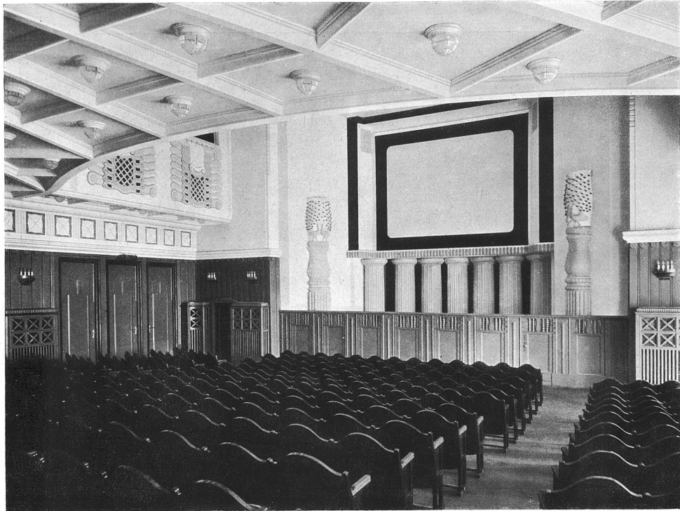
Der Kinosaal im Hause Du Pont zu Zürich. — Blick nach der Projektions-Wand. Architekten Haller & Schindler, Zürich.

Stimmung schwarz, weiss, grau mit wenig grün. — Aufnahme von Ph. und E. Link, Zürich.