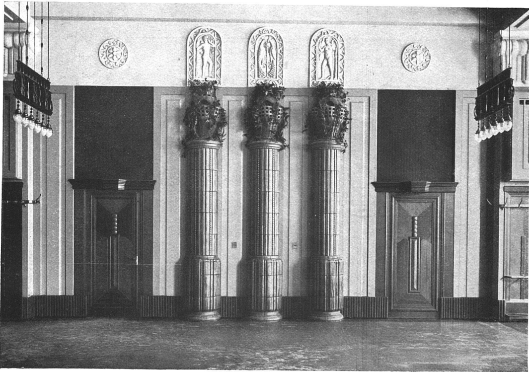
Detail aus dem grossen Restaurant. — Relief von Bildhauer Gysler, Zürich. Säulen in Schmelzglasur von Robert Mantel, Elgg.

Aus dem Hause Du Pont zu Zürich. — Architekten Haller & Schindler, Zürich.