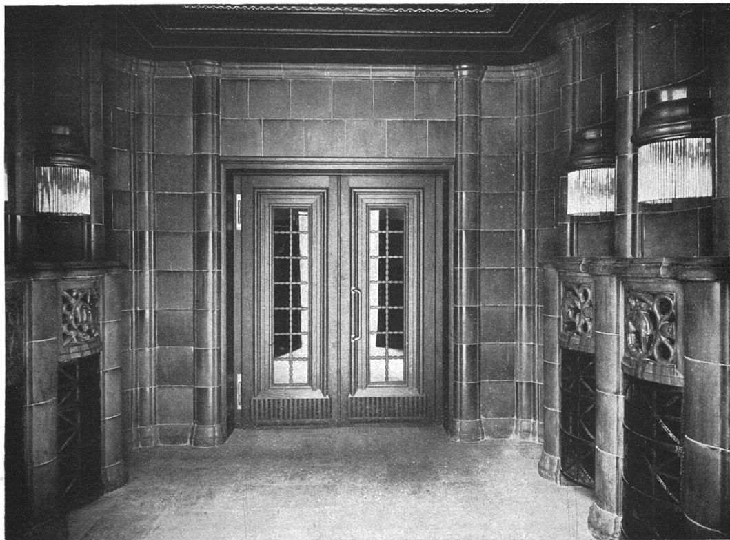
Das Haus Du Pont zu Zürich. — Entrée zum Restaurant vom Beatenplatz aus. Architekten Haller & Schindler, Zürich. In grünlichen Schmelzglasuren ausgeführt von Robert Mantel, Elgg.