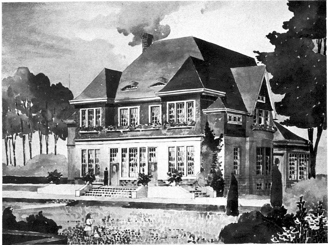
Entwurf für eine bergische Villa. Architekt Emil Rein (Zürich), Düsseldorf.