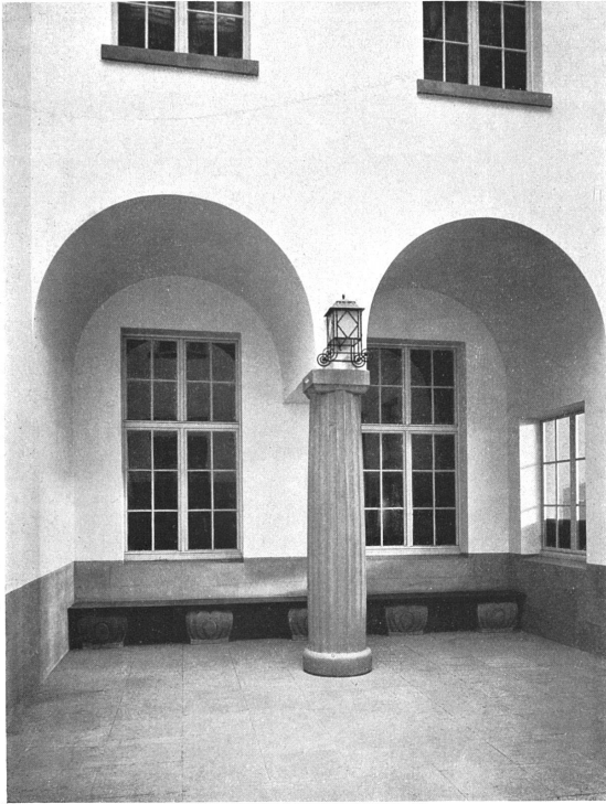
Blick in das Höfchen seitlich der Schalterhalle gegen den deutschen Gepäckraum. Vergleiche Grundriss Seite 189 Nr. 43.