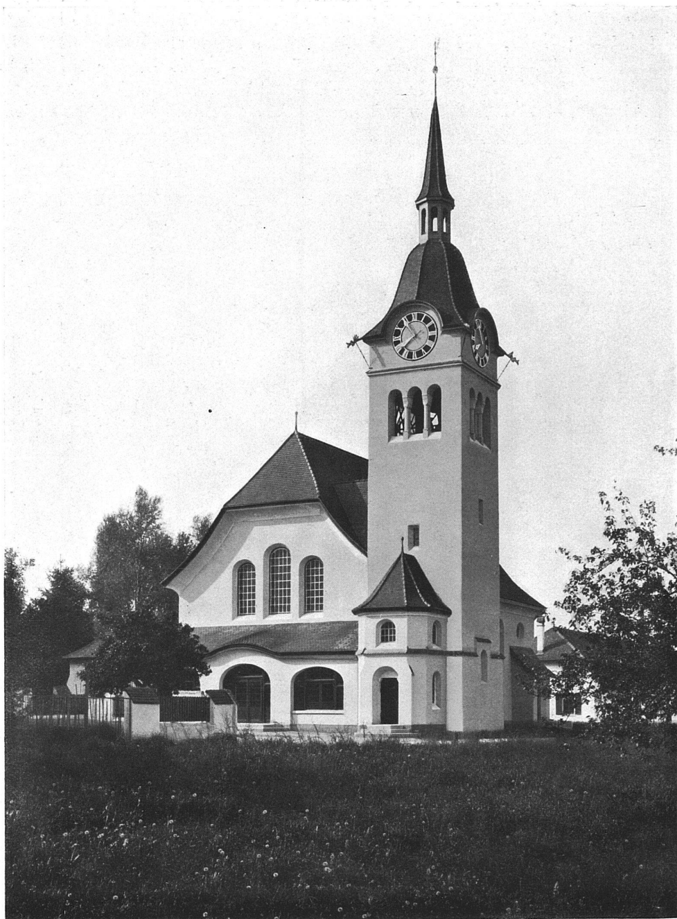
Die reformierte Kirche zu Arlesheim. Architekten La Roche, Stähelin & Co., Basel.