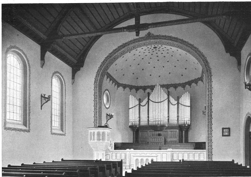
Die reformierte Kirche zu Arlesheim. — Blick nach Kanzel und Orgel. Architekten La Roche, Stähelin & Cie., Basel.