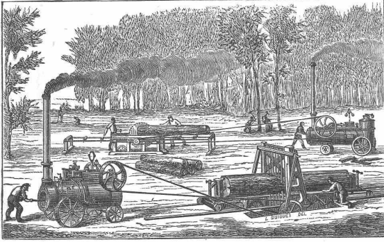
Medaille Breslau 1868

Exposition universelle de 1878. — Médaille d'or.