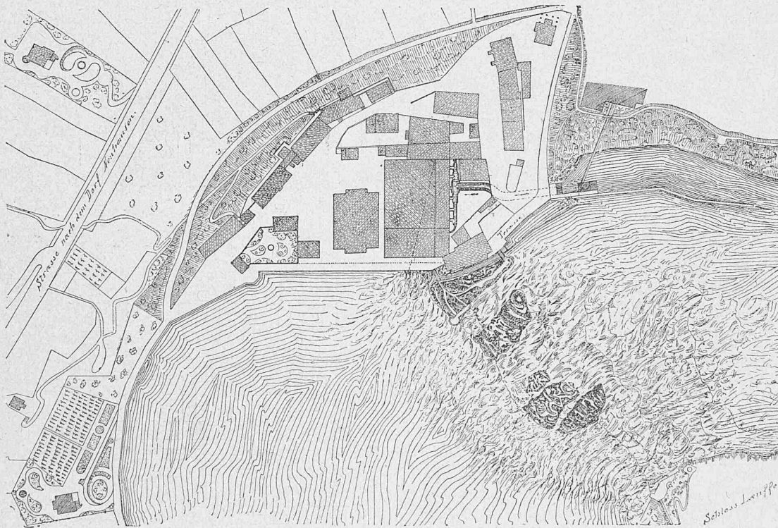
Fig. 1. Lageplan. — Masstab 1 : 2600.

wendungen der Elektrizität haben denn auch trotz des im Lande bestehenden Mangels an Rohstoffen eine Fülle neuer Industrien hervorgebracht. Eine der ersten darunter hatte zum Zwecke, die Erfolge, welche Männer wie Davy, Bunsen, Deville und Wöhler in ihren Laboratorien erzielt hatten, in das Bereich der industriellen Wirklichkeit überzuführen, indem in der Schweiz die erste Aluminium-Fabrik des Kontinents entstand, nämlich in Neuhausen am Rheinfall. *)