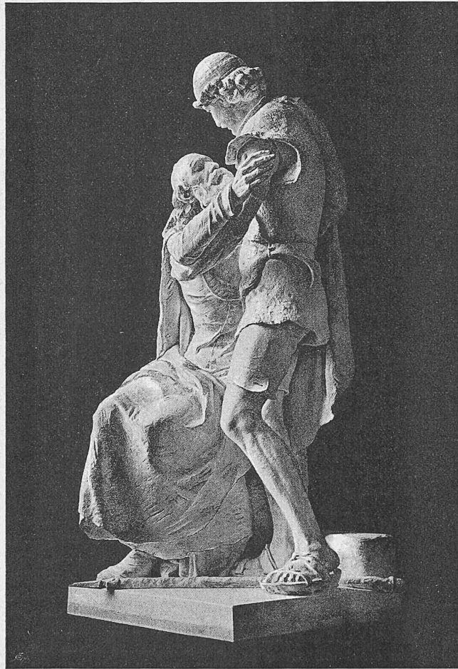
Nach einer Photographie.

Von Bildhauer Richard Kissling in Zürich.