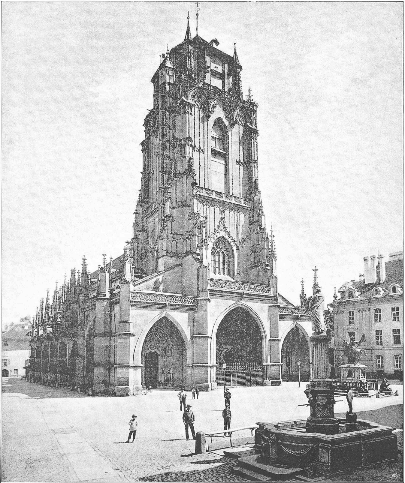
Das Münster zu Bern.