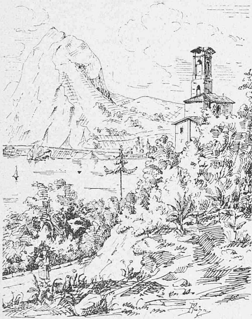
Kirche von Castagnola.

Die Fundierung der Villa bot mancherlei Schwierigkeiten, indem das Terrain von Nord nach Süden bei einer Länge von nur etwa 16 m ganz erhebliche Differenzen betreffend die Stabilität des Baugrundes aufwies. Die Nordmauer z. B. erforderte gar keine weitere Fundierung, indem gewachsener Fels vorgefunden wurde. Die Fundierung der Südmauer dagegen, ganz besonders diejenige des Turmes und der Loggia, musste auf 3,80 m tief gegraben, und da