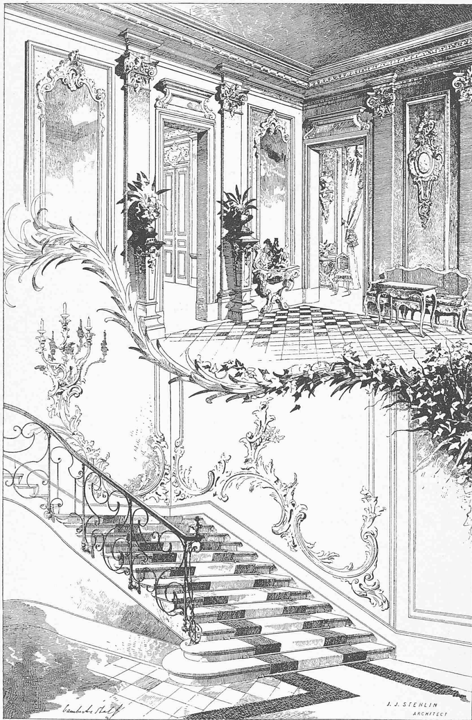
Vestibule und Treppenhaus.

Villa Stehlin-Burckhardt an der St. Alban-Anlage zu Basel.