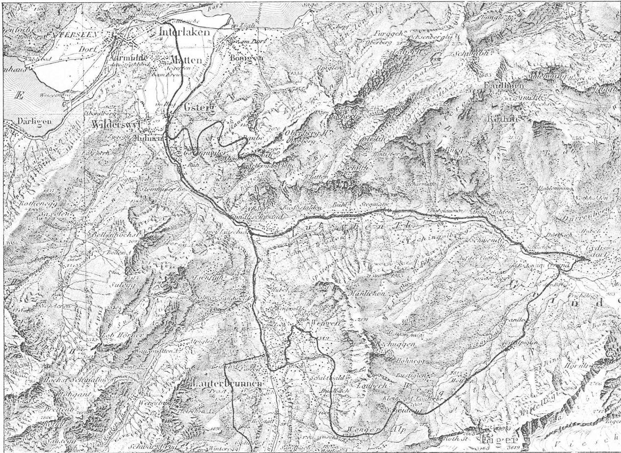
Bearbeitet nach der Dufourkarte mit Genehmigung des eidg. topographischen Bureaus in Bern. 1 : 100 000.