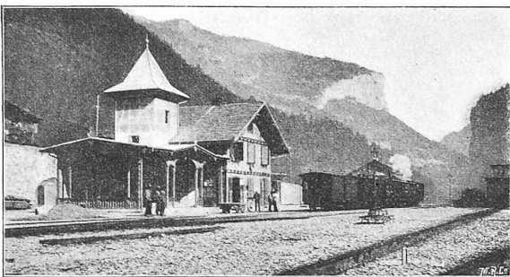
Fig. 33. Station Lauterbrunnen der B. O.-B.

die Verwaltung mit Rücksicht auf den Funkenwurf eine Anzahl in der Nähe der Bahn liegende Schindeldächer mit Ziegeln bedecken lassen. Im Oktober 1893 wurden etwa ein Dutzend Firnen längs der Bahn durch den Föhn abgedeckt. Dass dies auf den Eisenbahnbetrieb störend wirken kann und den Zugsdienst erschwert, ist begreiflich. Die Standfestigkeit der Wagen zeigte sich bis anhin als hinreichend; rechnermässig wäre ein Winddruck von wenigstens 110 kg auf das m 2 der Seitenfläche notwendig, um die Wagen umzukippen.