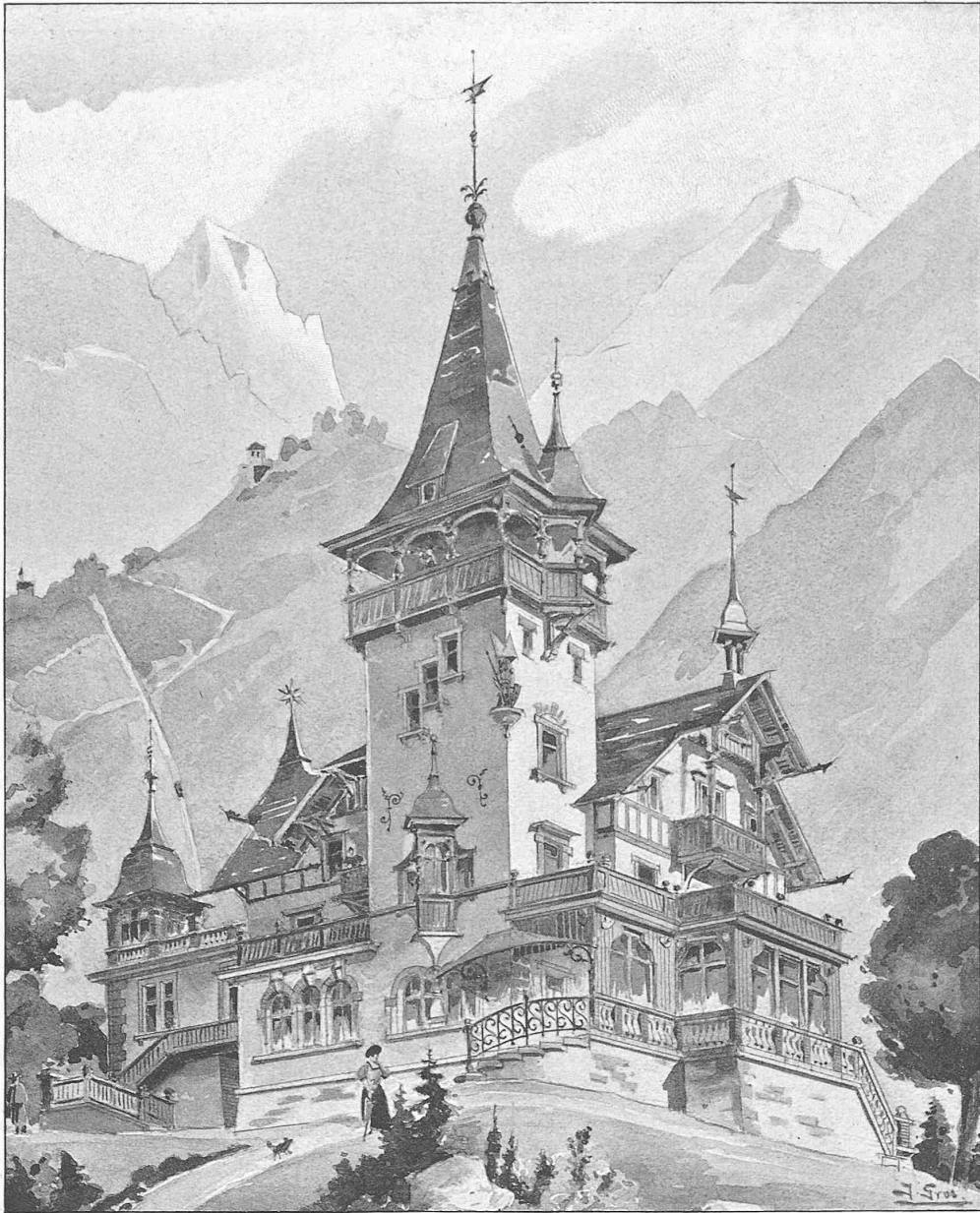
Villa Sonderegger in Ragaz.

An beiden Längsseiten der Halle reihte sich eine Anzahl von Verkaufsbuden, deren Bauart nebst dem Schnitt des Gebäudes aus Fig. 4 ersichtlich ist. Die Wände dieser Buden hatte man mit bemalter Leinwand dekoriert,