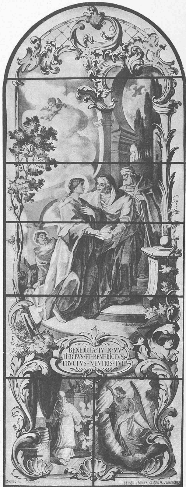
Glasgemälde für die Gnadenkapelle des Klosters Mariastein im Kanton Solothurn.

Entworfen, gezeichnet und in Glas ausgeführt von Meyner & Booser in Winterthur.