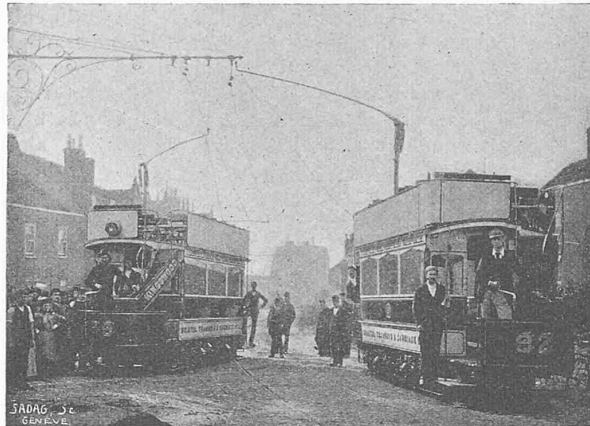
Fig. 1. Kreuzung auf der Linie Bristol-St. George-Kingswood.