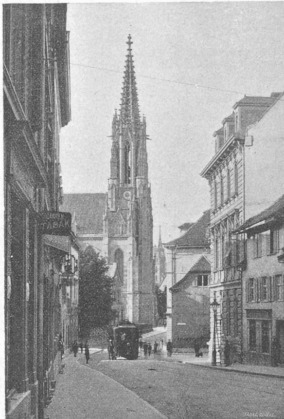
Fig. 12. Ansicht der Elisabethenstrasse.