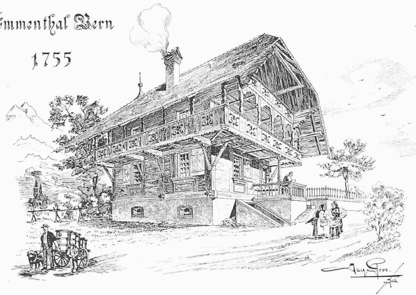
Emmenthal Bern 1755