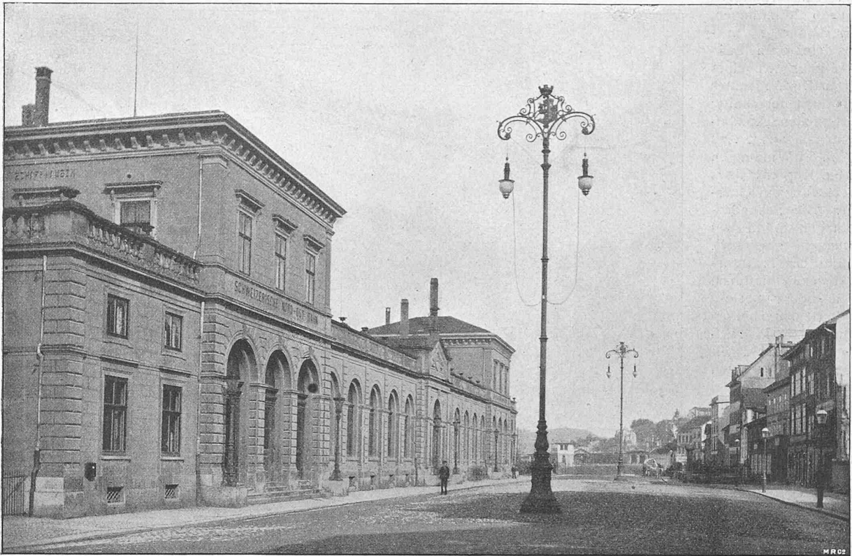
Fig. 22. Bogenlampen-Kandelaber auf dem Bahnhofplatz.