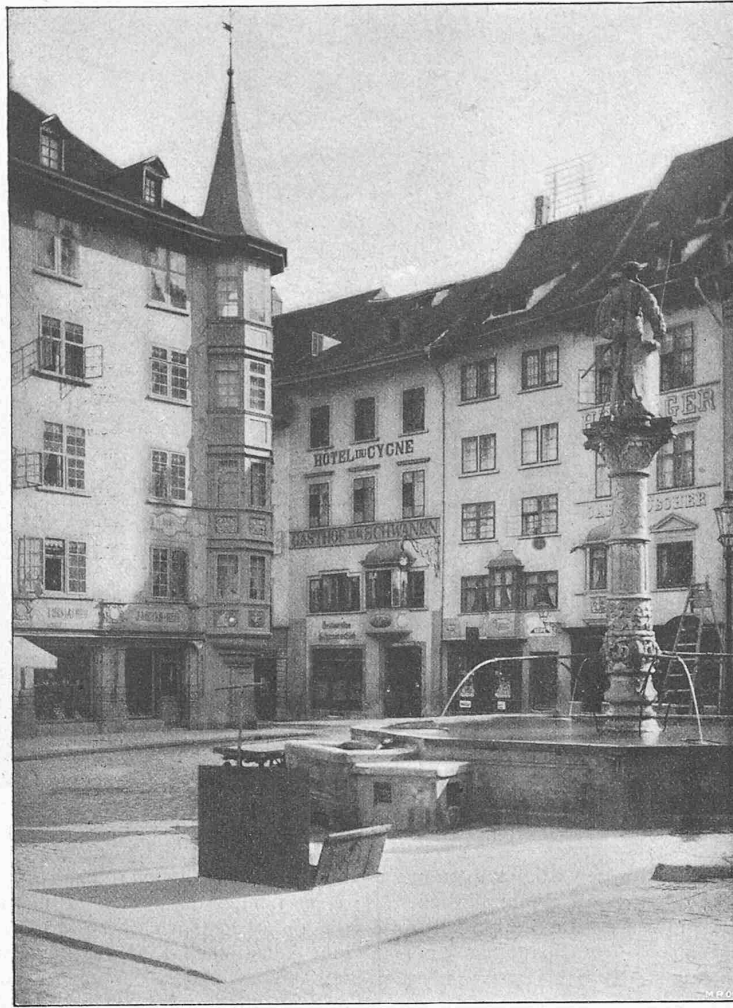
Fig. 21. Frohnwaagplatz mit der unterirdischen Transformatorstation.