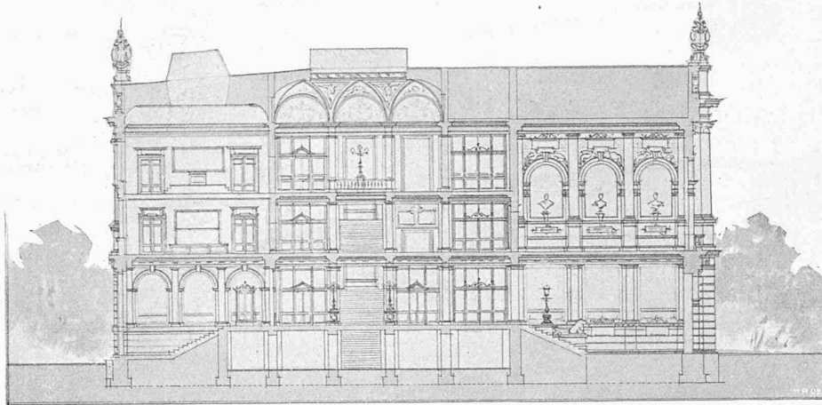
Querschnitt I : 400.