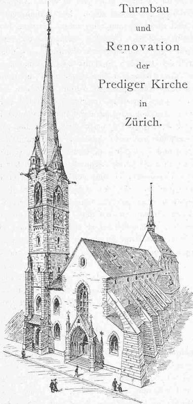
Turmbau und Renovation der Prediger Kirche in Zürich.

front zu stehen; er misst 7 m im Geviert und erhält eine Höhe von 43 m vom Boden bis zu den Wasserspeiern und 40 m von da bis zur Helmspitze, somit beträgt die ganze Höhe 83 m, also nur unbedeutend weniger als diejenige des Frau- münsterturmes, welcher eine Höhe von etwa 90 m erreicht.