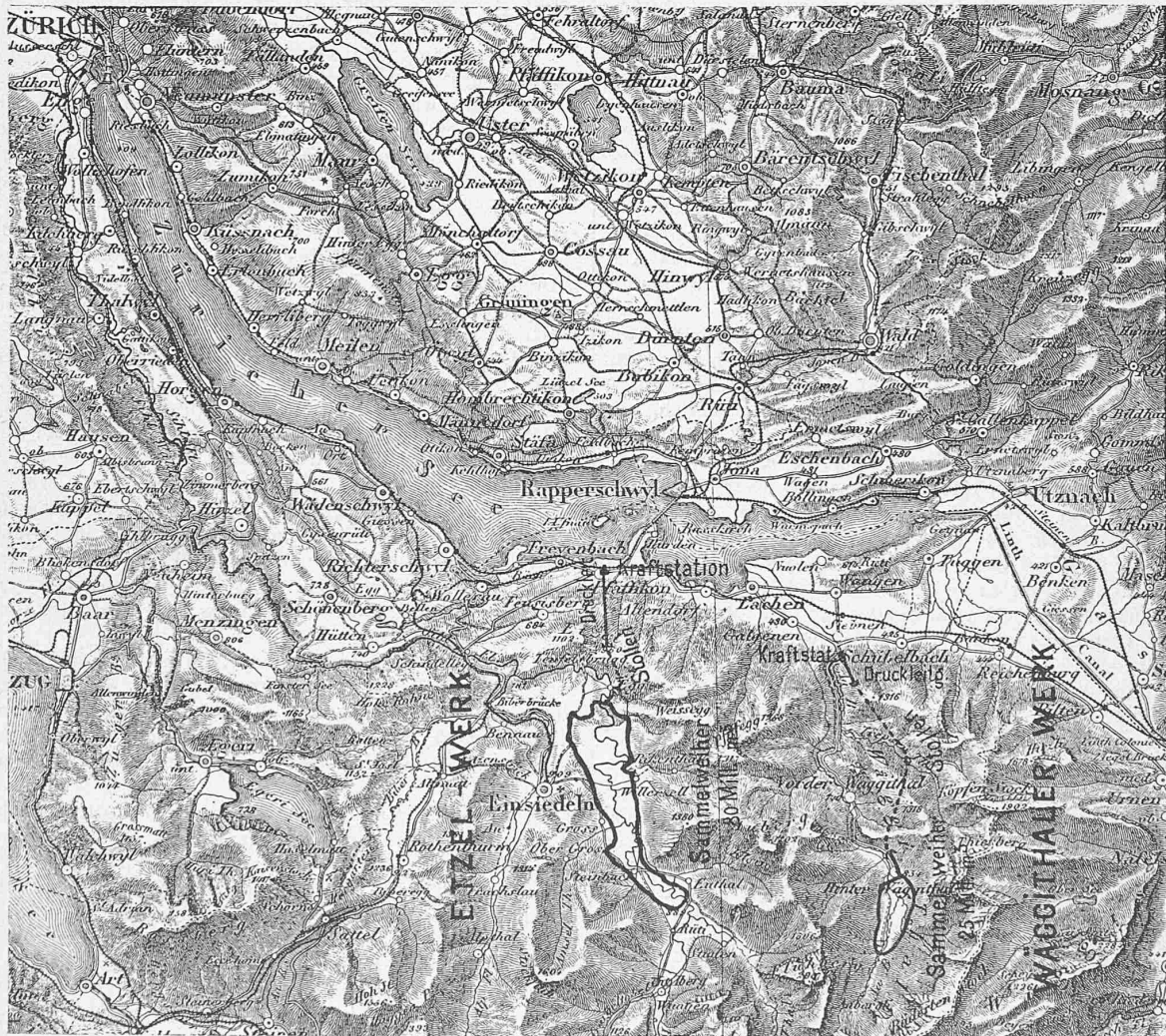
Bearbeitet nach der Schweiz. Generalkarte.

Zwei Projekte, welche in eminenter Weise diesen allgemeinen, von einem grossen modernen Elektrizitätswerke zu erfüllenden Forderungen genügen, sind neuerdings viel besprochen worden: das von einem Konsortium, gestützt auf Arbeiten der Firma Locher & Cie. in Zürich, ausgehende Projekt Wäggithal-Siebenen und das von der Maschinenfabrik Oerlikon an Hand genommene, und von Herrn Ingenieur Kürsteiner in St. Gallen aufgestellte Pro-