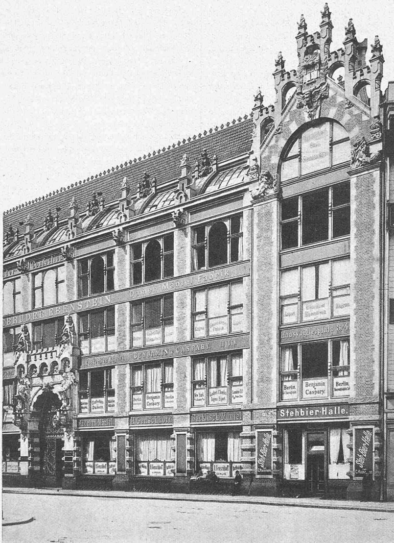
Fig. 8. Warenhaus Prudentia, Hausvogteiplatz 3—4.

Architekten: Allerthum & Zadeck (Krause) in Berlin.