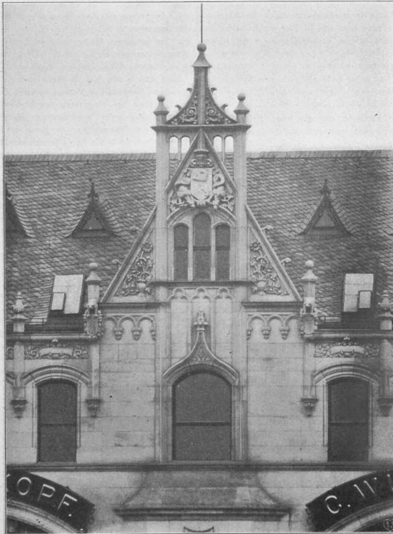
Fig. 44. Kaufhaus, Burgstrasse 1.

Architekten: Allerthum & Zadek in Berlin.