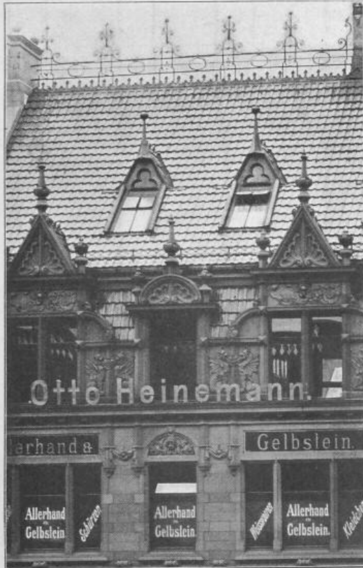
Fig. 48. Kurfürstenhaus, Burgstrasse 3-4.

Architekt: Reg.-Baumeister Gause in Berlin.