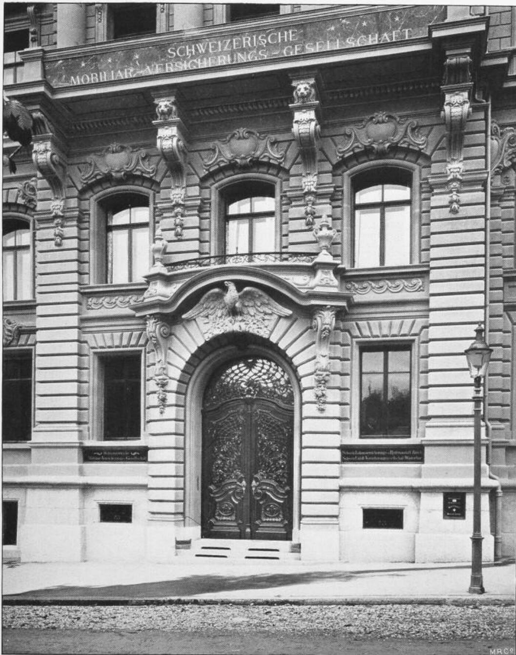
Verwaltungsgebäude der Schweizerischen Mobiliar-Versicherungs-Gesellschaft in Bern.

Architekten: Lindt & Hünérwadel in Bern.