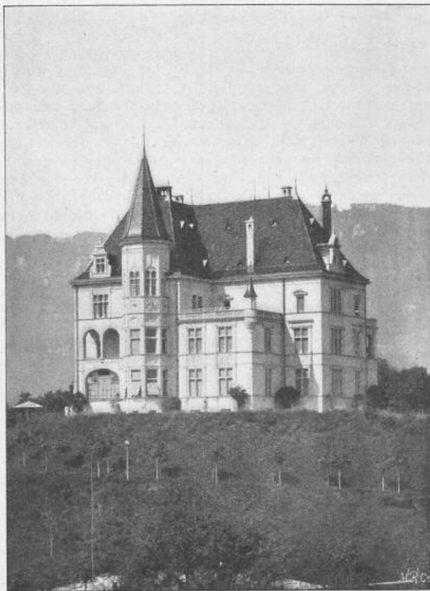
Aetzung von Meisenbach, Riffarth & Cie. in München.