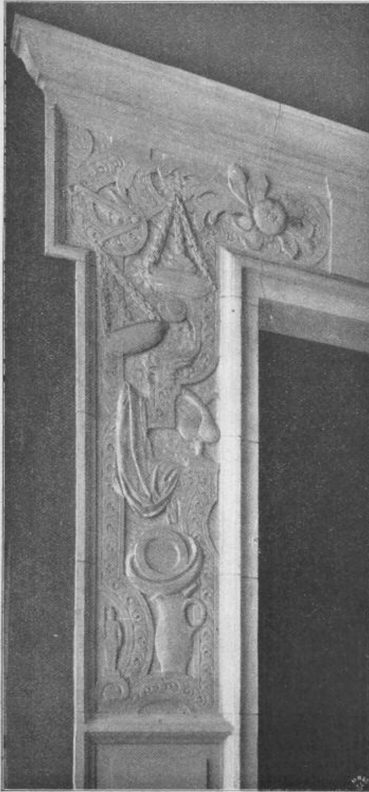
D. B. Fig. 68. Thürrahmen der Treppeneingänge.

Architekten: Messel & Altgelt in Berlin.