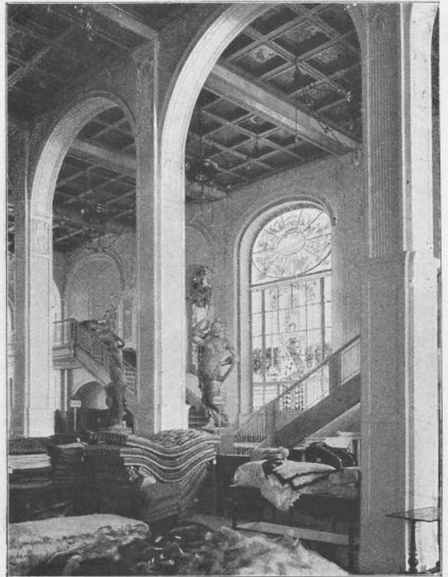
B. A. W. Fig. 69. Teppichraum.

Architekten: Messel & Altgelt in Berlin.