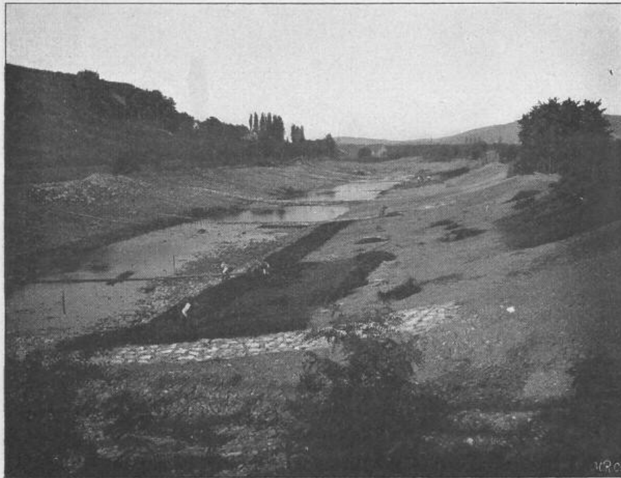
Oben rechts im Vordergrund Graswuchs 0,20 cm, Mittelgrund, Graswuchs 0,20 cm.