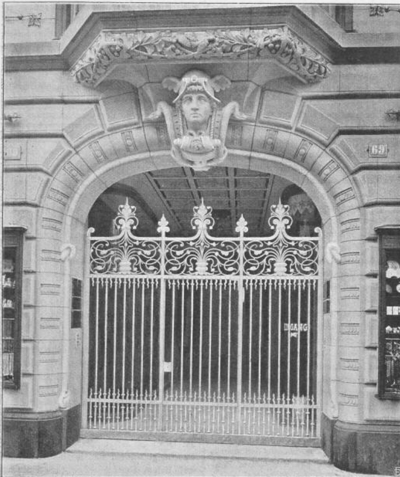
Haupteingang an der Bahnhofstrasse.

Architekten: Pfeghard & Häfeli in Zürich.